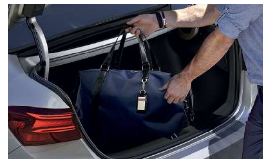
Багажное отделение вместимостью 502 л