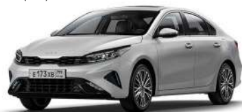
Silky Silver (4SS)