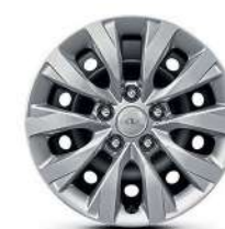
16" 205/55 R16 Стальные диски (с декоративными колпаками)