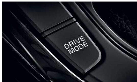
Система выбора режима движения