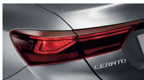
Галогенные задние фонари