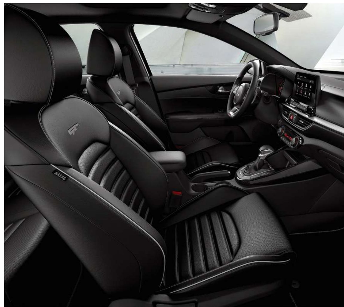
Версия GT-Line. Черная кожа