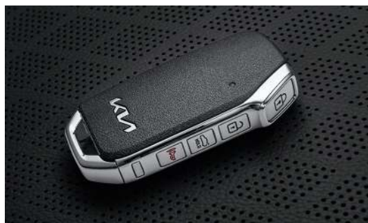
Система бесключевого доступа Smart Key и запуск двигателя кнопкой