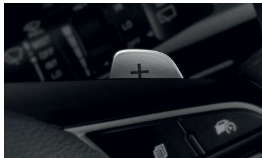
Подрулевые рычаги переключения передач