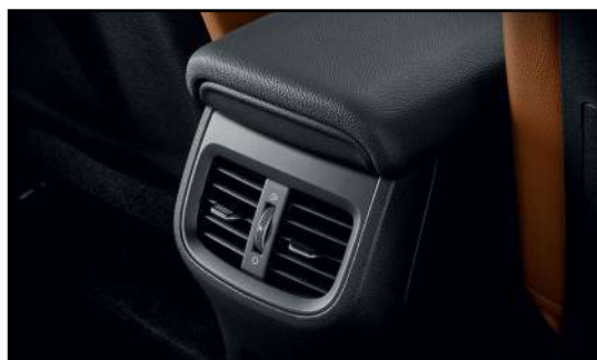
Дефлекторы климатической системы для пассажиров второго ряда