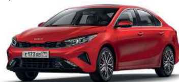
Runway Red (CR5)