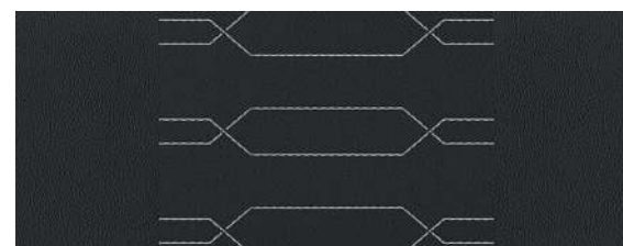
Версия GT-Line. Черная ткань