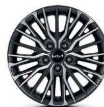
17" 225/45 R17 Литые диски Темно-серый металл