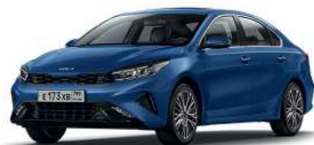
Mineral Blue (M4B)