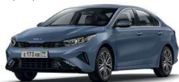
Horizon Blue (BBL)