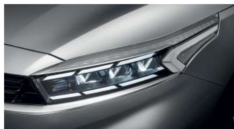
Полностью светодиодные фары