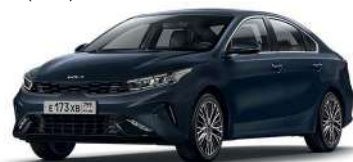
Gravity Blue (B4U)