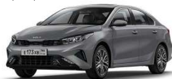
Steel Gray (KLG)