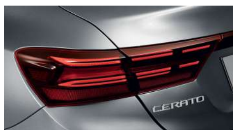
Задние светодиодные фонари