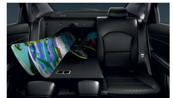
Складывающиеся сиденья в пропорции 60:40