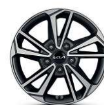
16" 205/55 R16 Литые диски Темно-серый металл