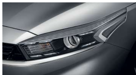
Галогенные фары со светодиодными ходовыми огнями