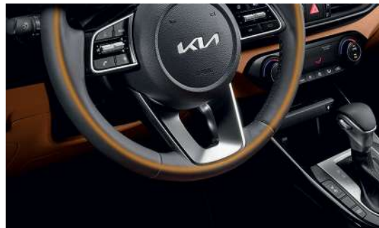
Рулевое колесо с подогревом

Что делает Kia Cerato идеальным партнером в поездках и путешествиях? Это полностью зависит от вас. Выберите из множества опций комфорта, технологий те, которые отражают ваше видение совершенства. И вы убедитесь, что каждая минута, которую вы проведете в Cerato, доставит вам радость.