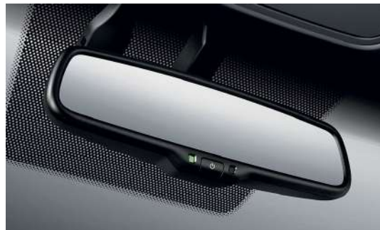
Зеркало заднего вида с автозатемнением