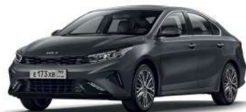
Platinum Graphite (ABT)