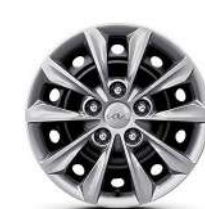
15" 195/65 R15 Стальные диски (с декоративными колпаками)