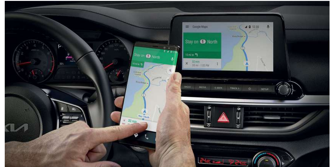
Android Auto и Apple CarPlay