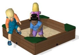
Песочница – модульная