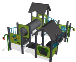
Четыре башни с туннелем