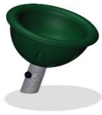
Вертушка – чаша