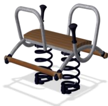
Качалка на двойной пружине