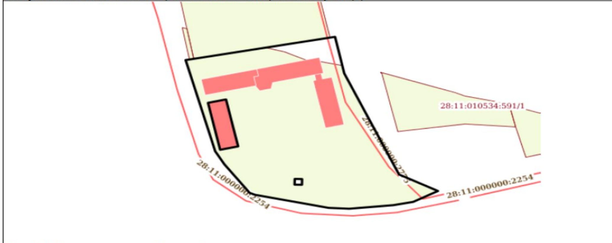
Схема расположения объекта недвижимости (части объекта недвижимости) на земельном участке(ах)