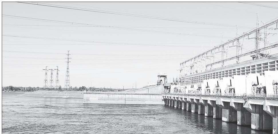
Современный вид Воткинской ГЭС

Перекрытие Камы в октябре 1961 года помогло решить многие важные задачи. Главная из них - максимально полное использование водно-энергетических ресурсов для получения большого количества недорогой электроэнергии. В районе расположения гидроузлов были созданы условия для развития террито-