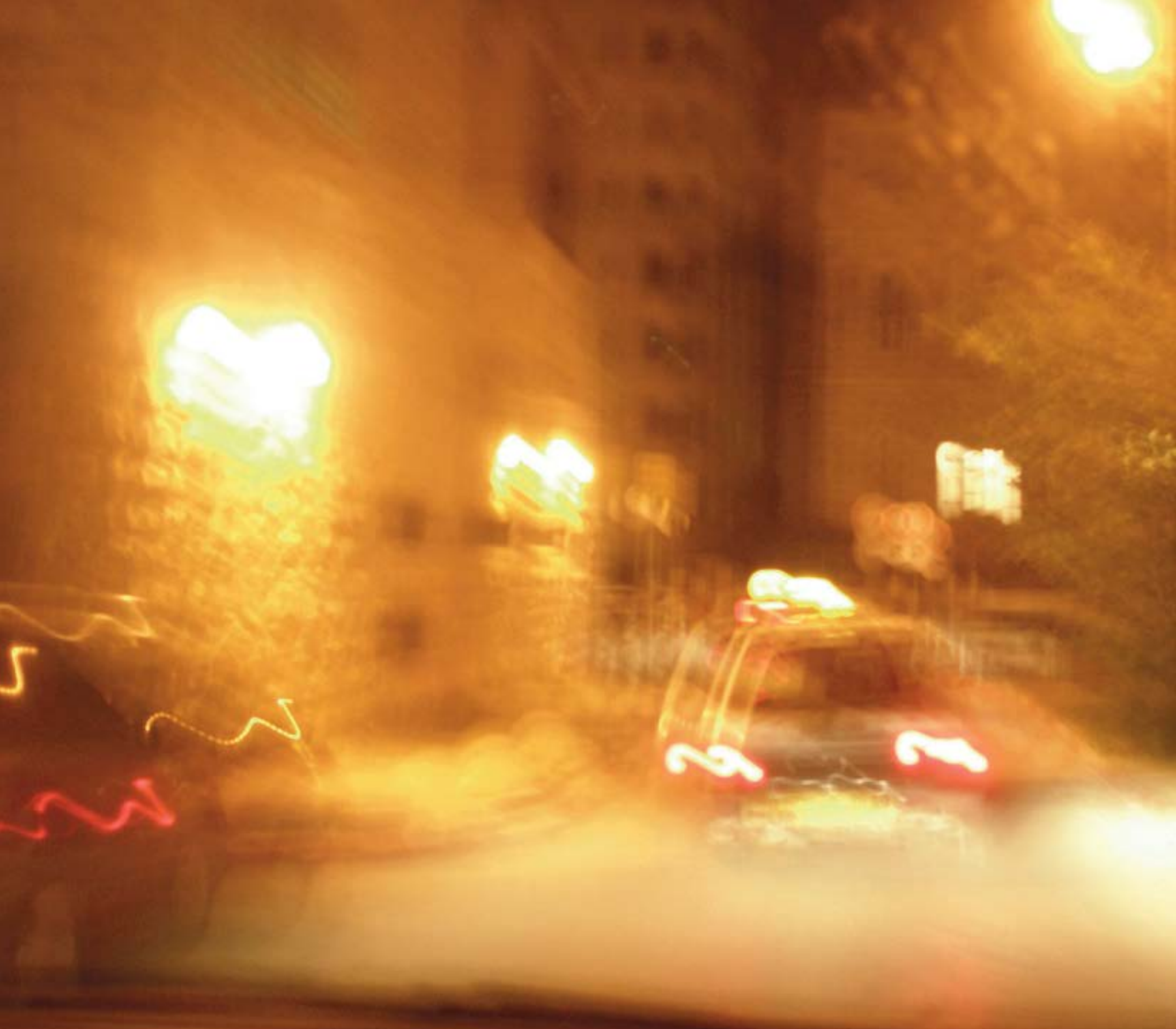
ПЕРЕЛЁТ БУКВ ИЗ ТЕЛЬ-АВИВА В ИЕРУСАЛИМ