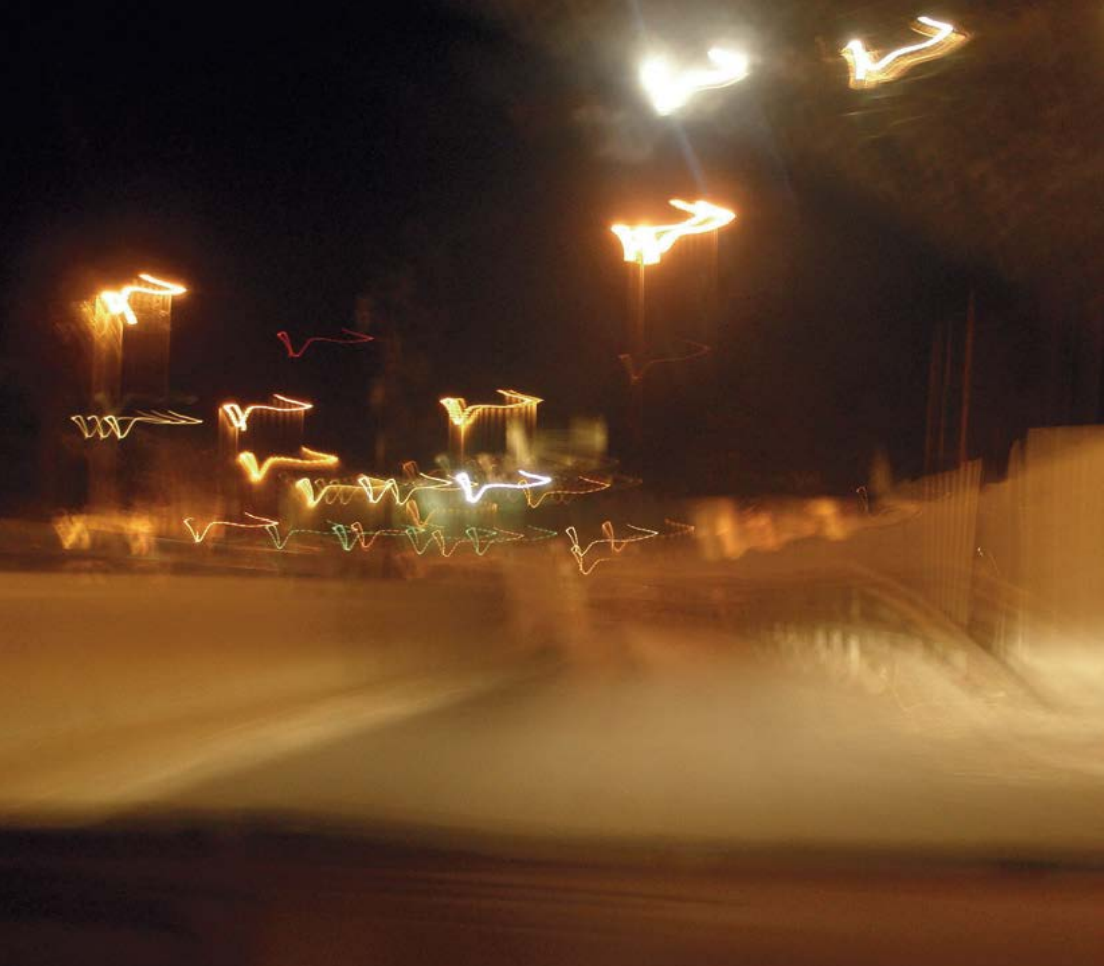
ПЕРЕЛЁТ БУКВ ИЗ ТЕЛЬ-АВИВА В ИЕРУСАЛИМ