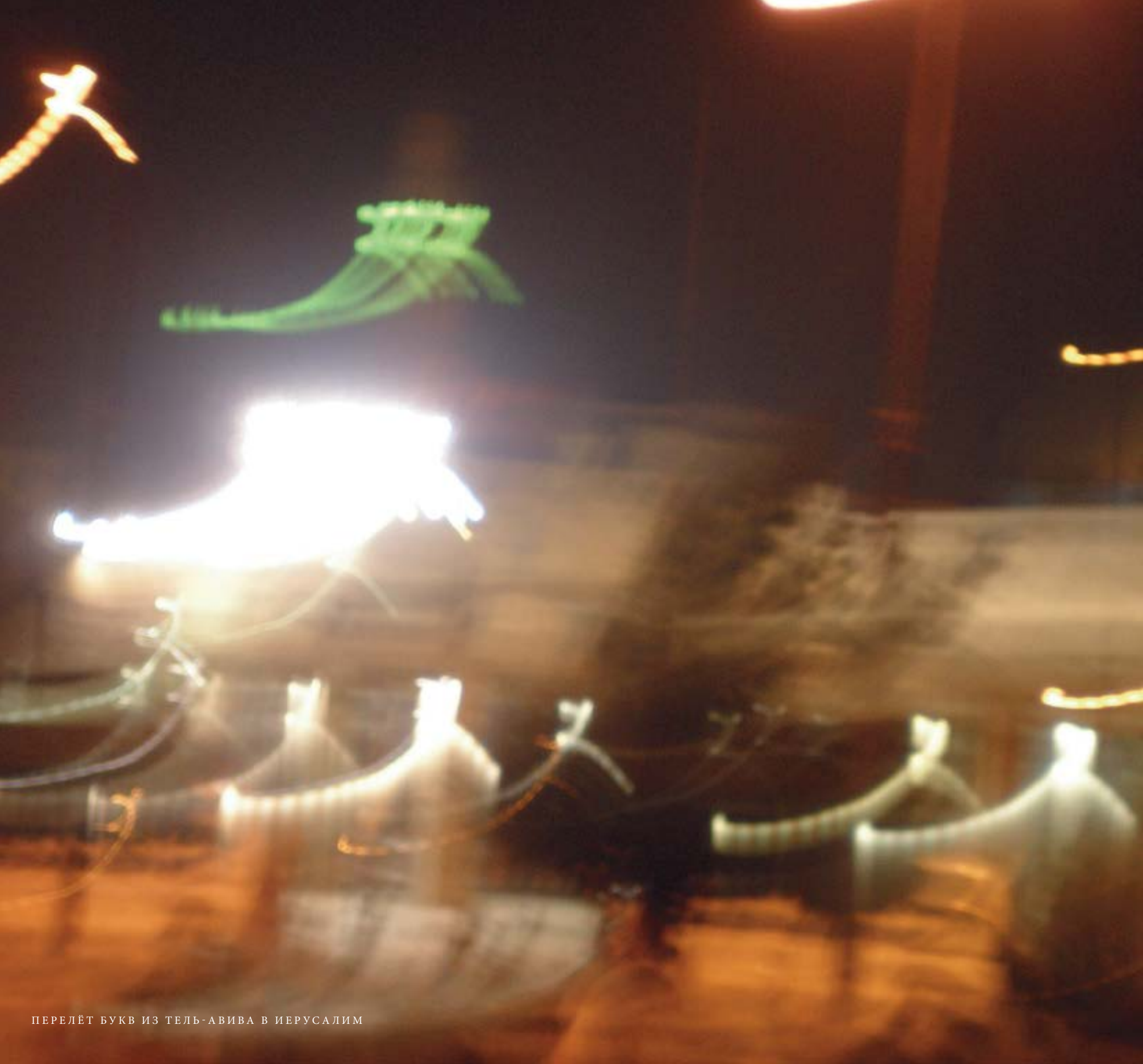
ПЕРЕЛЁТ БУКВ ИЗ ТЕЛЬ-АВИВА В ИЕРУСАЛИМ