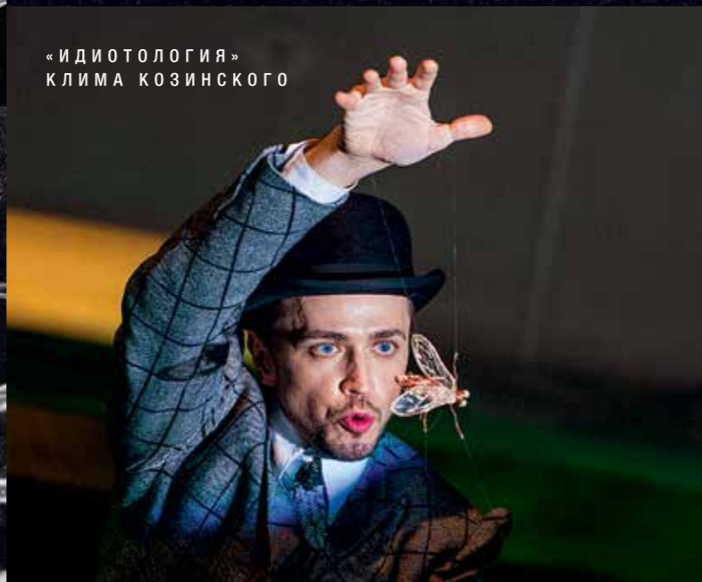
«ИДИОТОЛОГИЯ» КЛИМА КОЗИНСКОГО