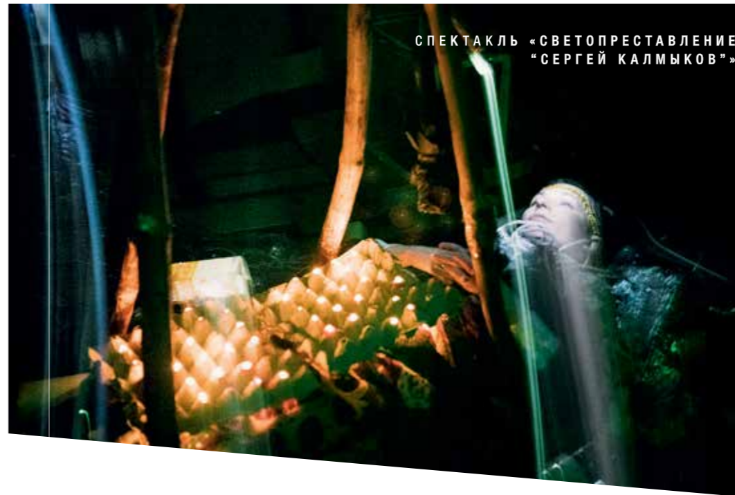
СПЕКТАКЛЬ «СВЕТОПРЕСТАВЛЕНИЕ «СЕРГЕЙ КАЛМЫКОВ»

Поэтому твой театр ORTA занялся первым концептуалистом Сергеем Калмыковым, сказавшим: «Я вступил в полосу бессмертия»? В картинах мало понимаю, но очень забавные вещи – «человек с орде-ном мухи», «лошадиная порция прекрасного». Когда читал его странные тексты, тронула непонятность, невозможность определить: или он сумасшедший, или он гений, или просто забавный дядька. Он про себя писал – простак, тупица, кретин, гроссмейстер линейных искусств, гений первого ранга Земли, космоса и его окрестностей. Саша Баканов, художник спектакля, назвал Калмыкова пустым местом. Я даже стал читать «Шизоанализ» Делёза и Гваттари, и понял, что ши-