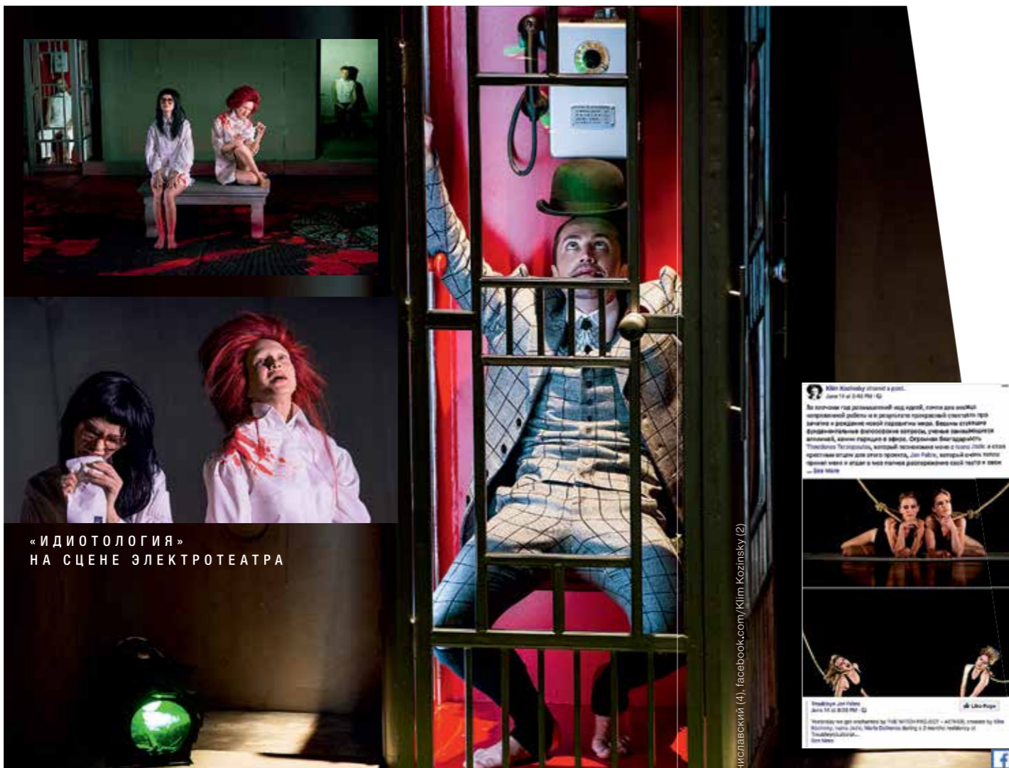
«ИДИОТОЛОГИЯ» НА СЦЕНЕ ЭЛЕКТРОТЕАТРА

А ты доволен дебютной «Идиотологией»? Все было небыстро и непросто. Главной задачей «Золотого осла» (метод тренировки студентов МИР-4, придумывающих модули, то есть этюды, мизансцены, мини-спектакли по роману Апулея) было создать, уберечь, удерживать свое произведение на протяжении долгих лет. Режиссура – профессия очень стран-