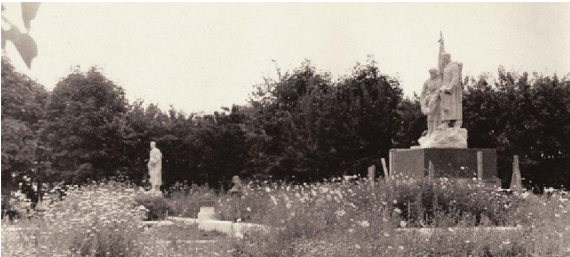
Так выглядело воинское захоронение в центре поселка Карманово полвека назад