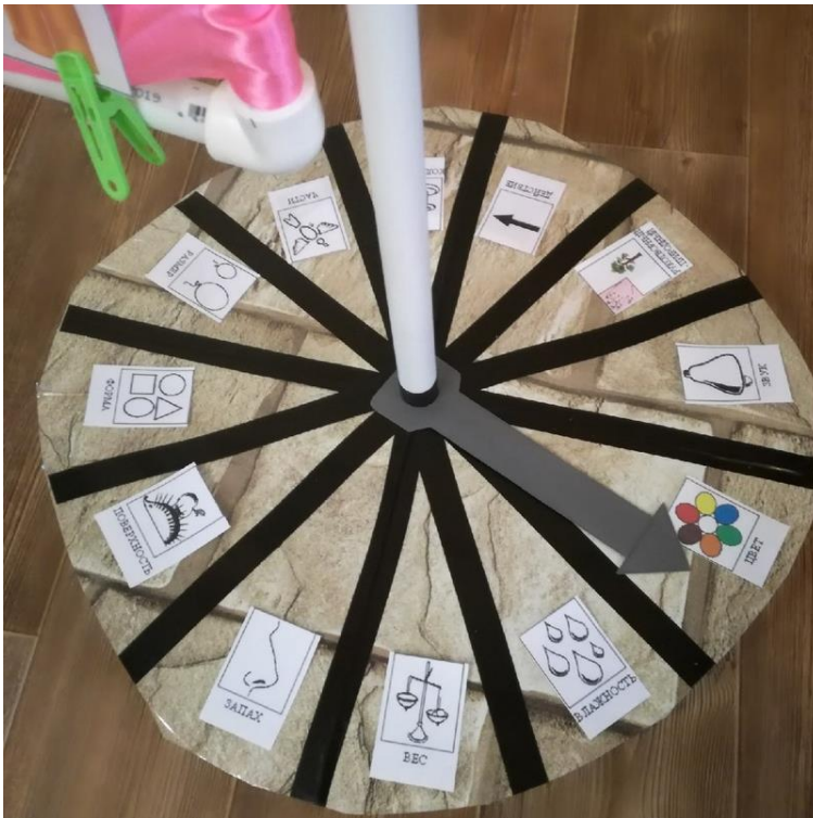
Карточки – обозначения: