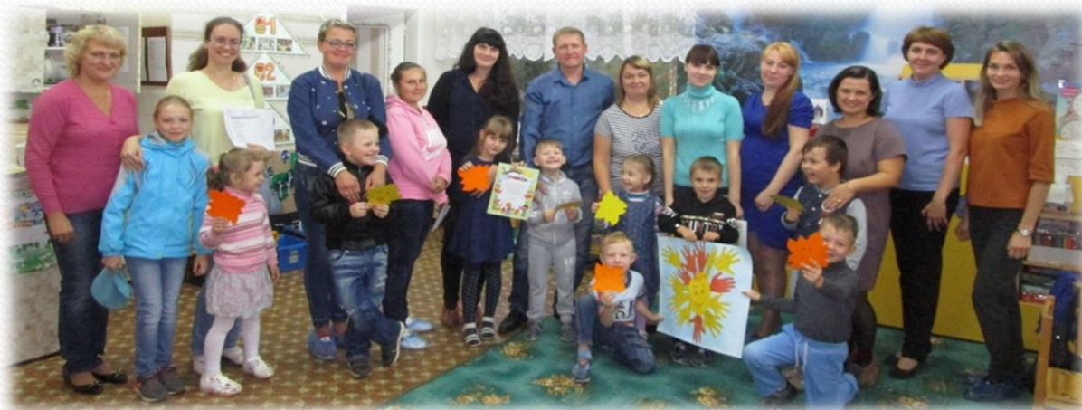
Коллективная творческая деятельность «Солнце группы»