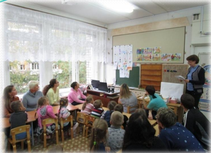
Игра «Угадай, чей портрет»