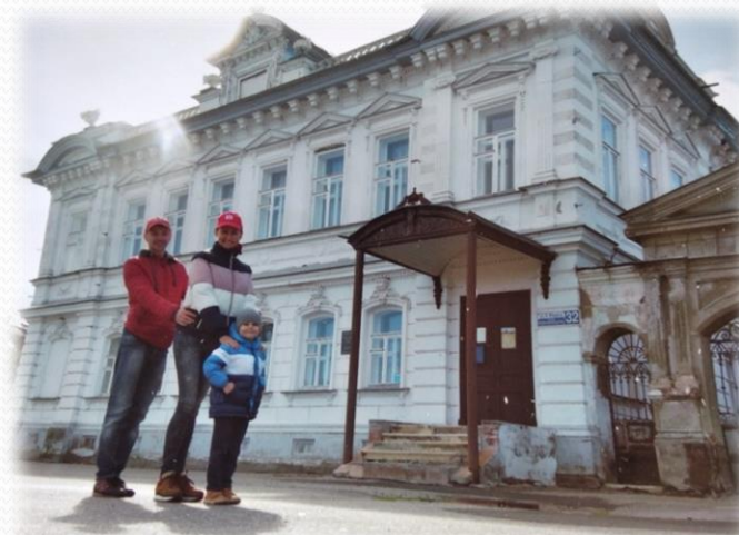
Музей-усадьба А.А. Худякова