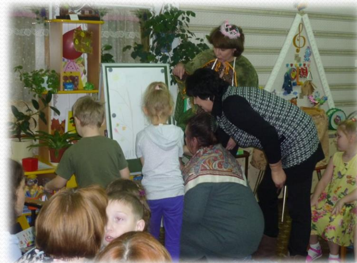
Создание пейзажа с Феей Творчества