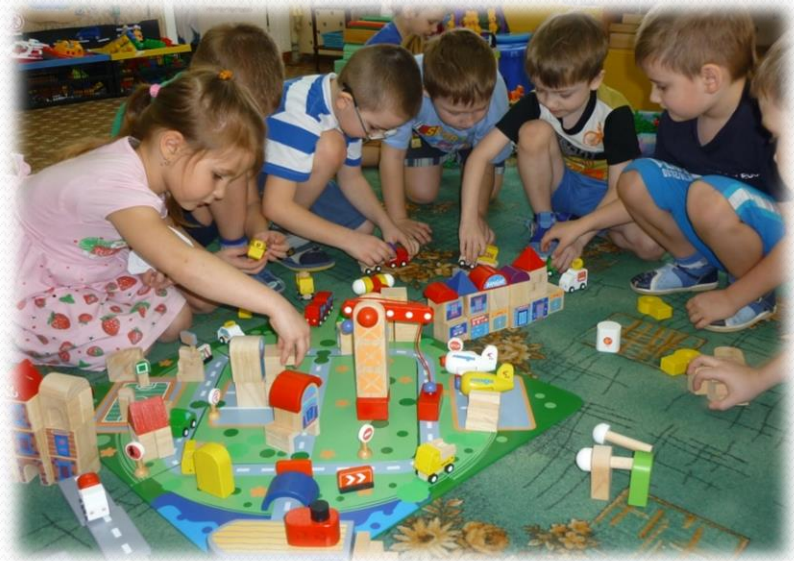
Строим безопасный город