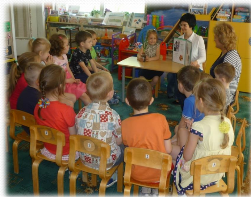
Презентация семейных рецептов блюд с луком