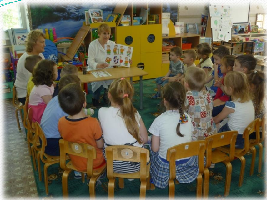
Беседа о пользе лука