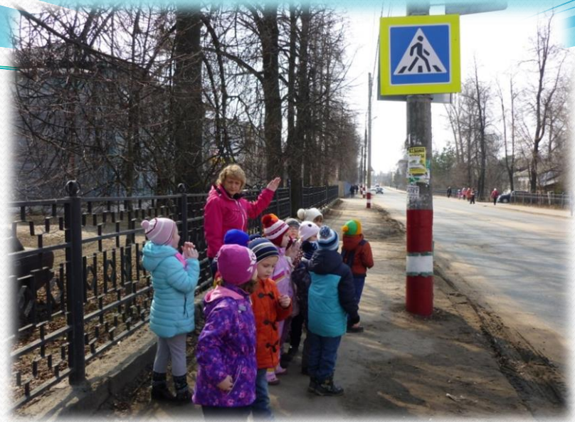
Экскурсия по улицам города