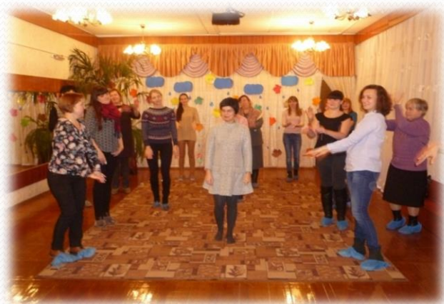
Флешмоб от родителей «Весёлые девчата»