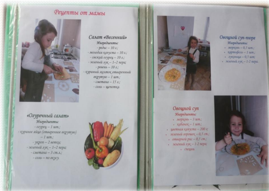
Создание кулинарной книги