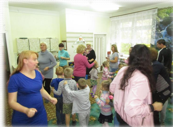
Музыкальная игра «Паровозик»