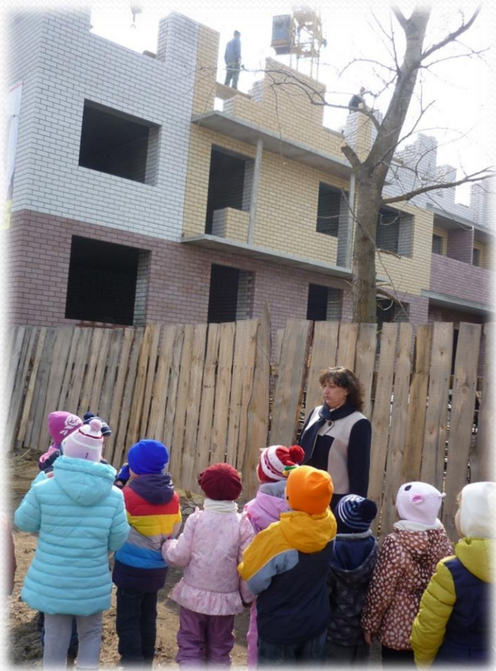
Экскурсия к стройке