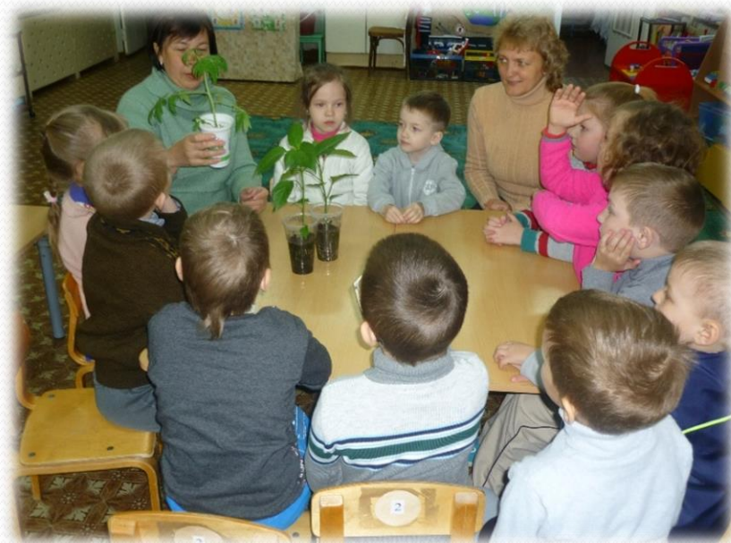
Беседа с бабушкой «Витамины на грядке»