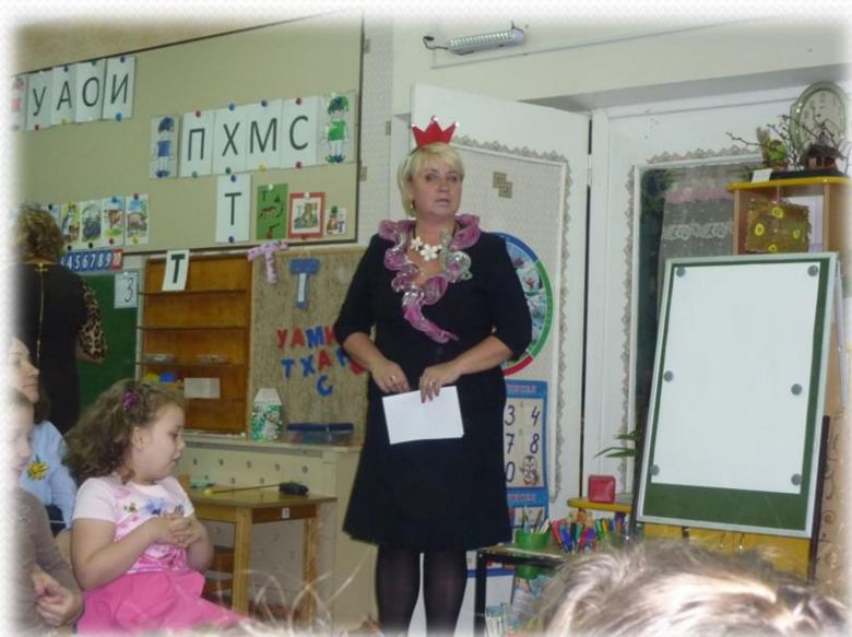
Игра с Феей Музыки