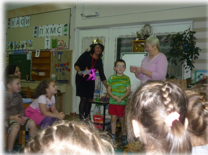
Создание стихов с Феей Красивой Речи