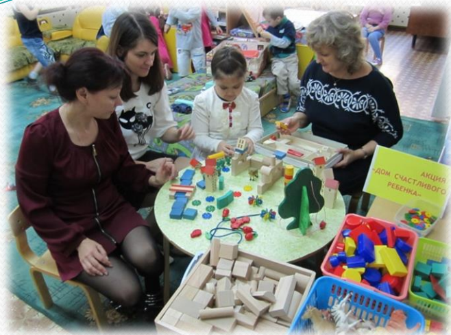
«Дом счастливого ребёнка»