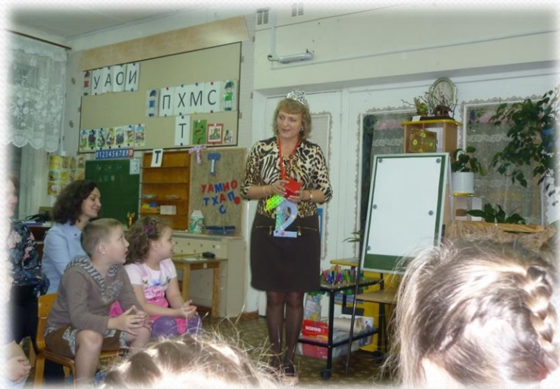
Интеллектуальная игра от Феи Математики