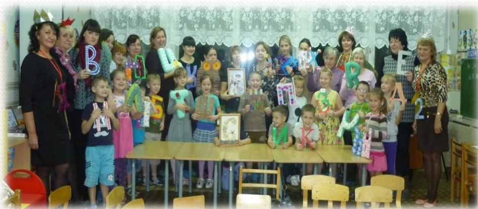
Клад с Волшебными Буквами найден!