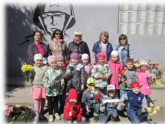
Обелиск погибшим воинам