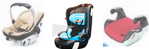
Автолюлька Автокресло Бустер