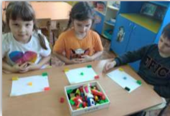
«Собери модель по ориентирам»