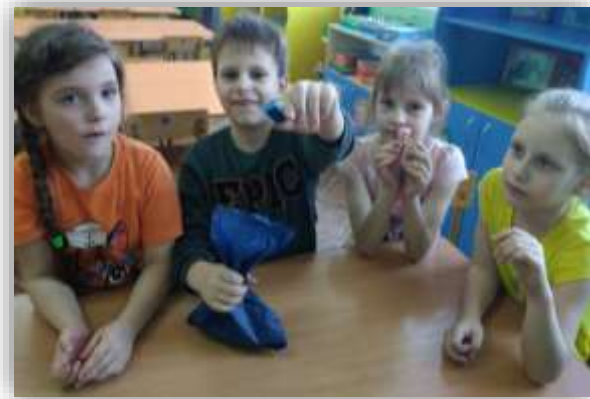
«Есть у тебя или нет»