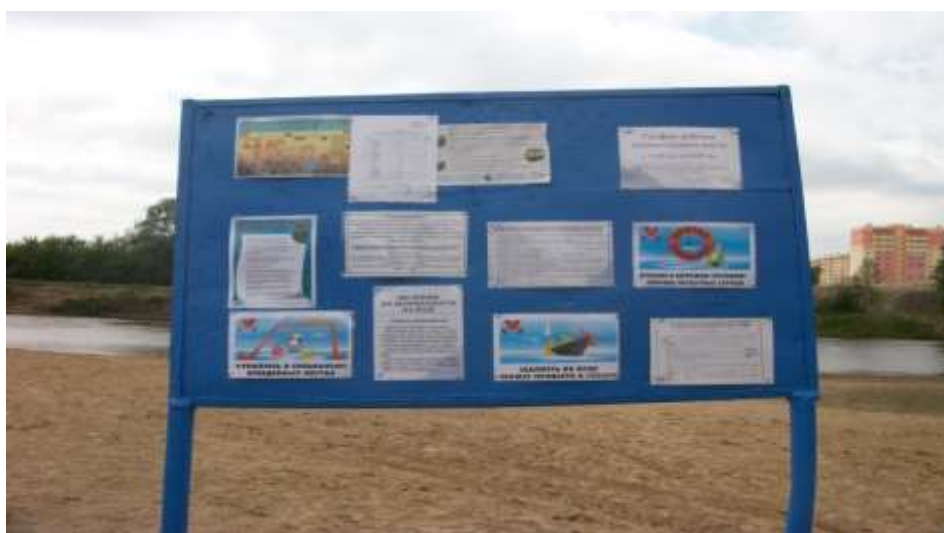
Рис. 2 Образец информационного стенда

- оборудуются стендами с материалами по профилактике несчастных случаев с людьми на воде, данными о температуре воды и воздуха, схемой акватории пляжа с указанием глубин и опасных мест;