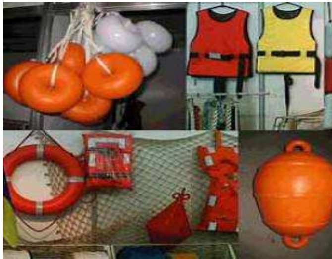
Рис. 3 Примеры комплектования спасательными средствами