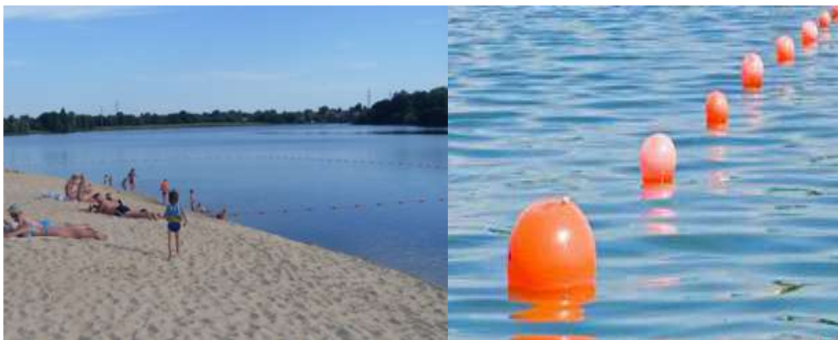
Рис. 1 Ограждающие буйки на акватории

Границы плавания в местах купания обозначаются буйками оранжевого, или красного цвета, расположенными на расстоянии 20-30м. один от другого и 25м. от места с глубиной 1,3м. Границы заплыва не должны выходить в зоны судового хода.