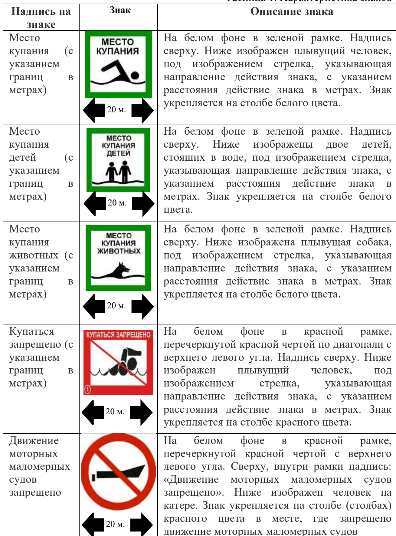
Таблица 1. Характеристика знаков

укрепляются на столбах, врытых в землю, допускается размещение знаков на стволах деревьев.