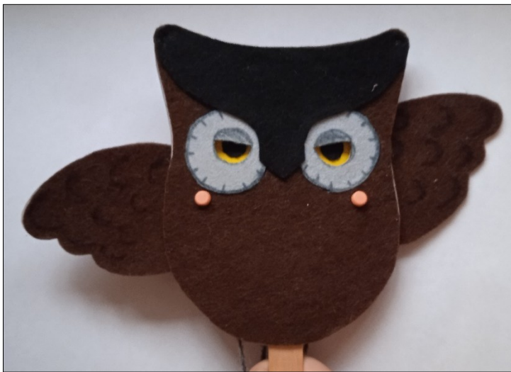
Шаблон для изготовления совы-дергунчика: