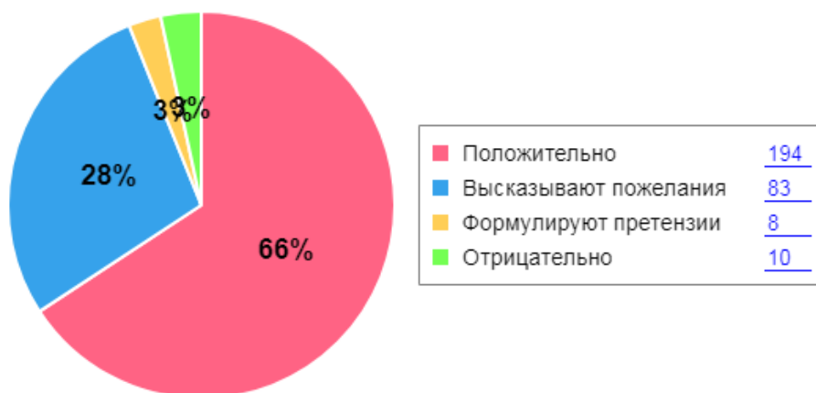
Как родители оценивают детский сад

Анкетирование родителей показало высокую степень удовлетворенности качеством предоставляемых услуг.