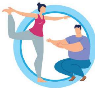
ВЕДИТЕ ЗДОРОВЬЙ ОБРАЗ ЖИЗНИ