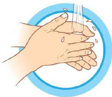
ЧАСТО МОЙТЕ РУКИ С МЫЛОМ