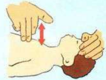
При остановке дыхания и сердечной деятельности провести искусственную вентиляцию лёгких и непрямой массаж сердца