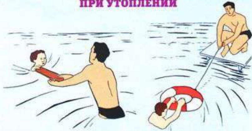
Извлечь утопающего из воды