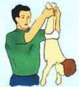
Потрясти ребёнка, удерживая его вниз головой за ножки