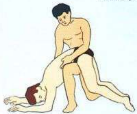
Удалить воду из дыхательных путей