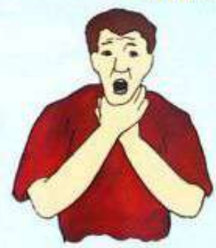
Срочно удалить инородное тело, попавшее в дыхательные пути