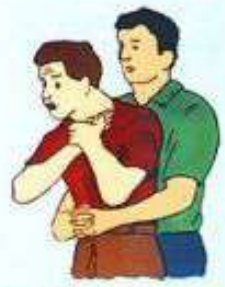
Произвести лёгкий удар спиной пострадавшего о свою грудь с одновременным толчком на верхнюю часть живота руками, сложенными в замок