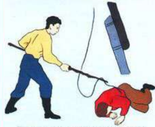
Срочно принять меры к прекращению воздействия электрического тока