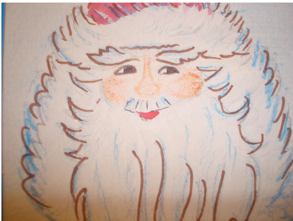
Воспитатель: Далее выскажем желание узнать о жизни деда Мороз