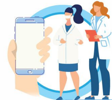
В СЛУЧАЕ ЗАБОЛЕВАНИЯ ОБРАЩАЙТЕСЬ К ВРАЧУ