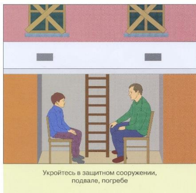
Укройтесь в защитном сооружении, подвале, погребе