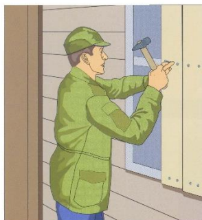
Закройте окна, двери, чердачные помещения