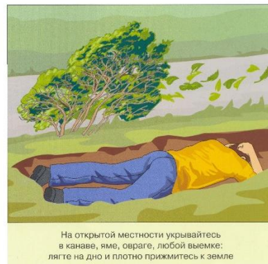
На открытой местности укрывайтесь в канаве, яме, овраге, любой выемке: лягте на дно и плотно прижмитесь к земле