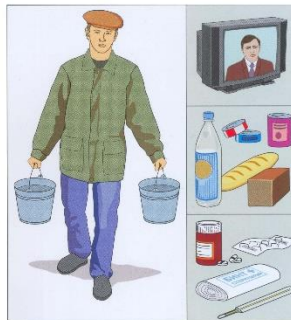
Запаситесь водой, продуктами, держите включёнными радиоточку, телевизор, приёмник