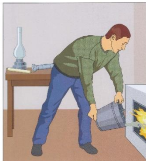
Выключите газ, потушите огонь в печах, подготовьте фонари, свечи, лампы