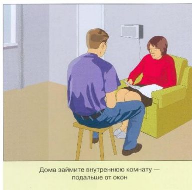
Дома займите внутреннюю комнату — подальше от окон