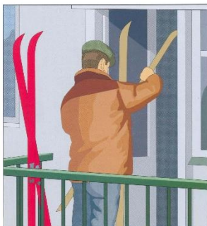
Уберите с балконов и лоджий всё, что может быть сброшено ураганом