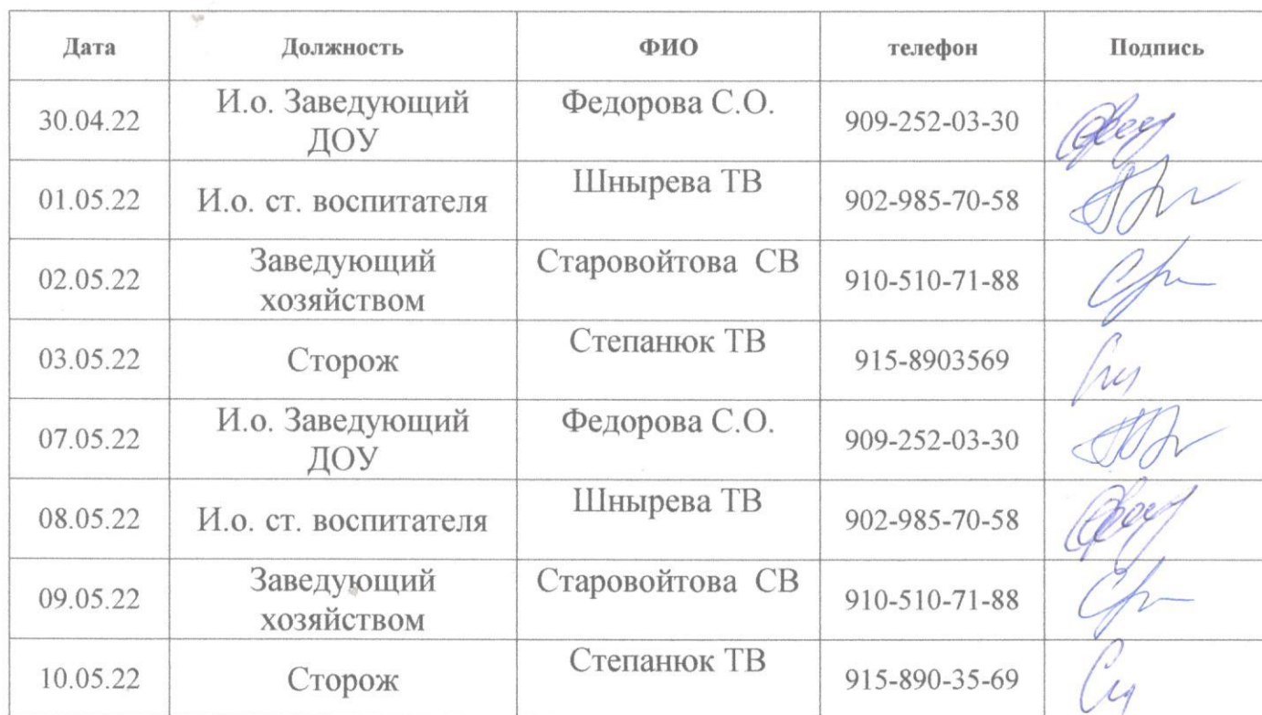
ГРАФИК ДЕЖУРСТВ В ПРАЗДНИЧНЫЕ ДНИ На период с 30.04.2022 по 10.05.2022 (по зданию и территории) в МБДОУ «ЦРР – детский сад «Россиянка»