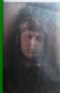
Прадедушка Перепелова Серёжи