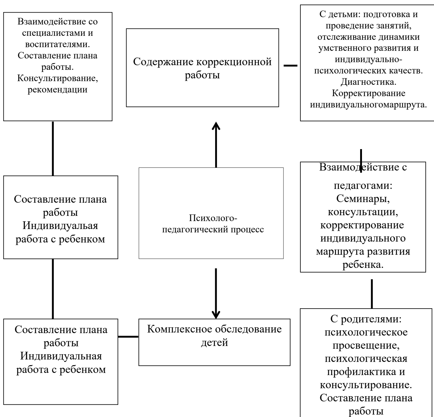
Схема организации работы педагога-психолога