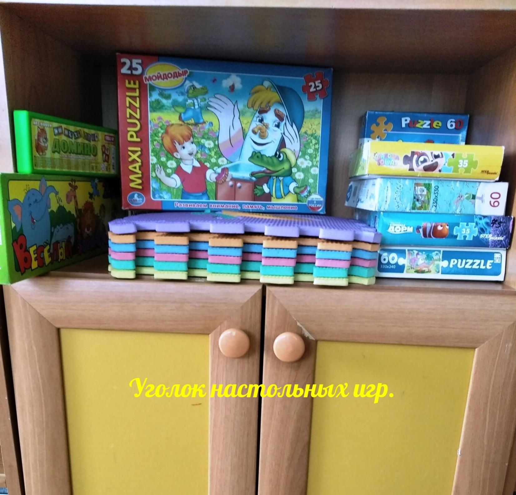
Уголок настольных игр.