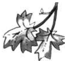
2. _ ( с клена ).