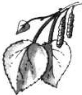
1. Берёзовый листик ( с берёзы )

4. Игра «С какого дерева листочек?» Рассмотрите картинки. Подумайте, с какого дерева сорваны нарисованные на них листья.