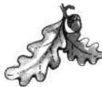
6. ( с дуба ).

Материал взят из пособия С. А. Васильевой «Рабочая тетрадь по развитию речи дошкольников», Москва 2002.