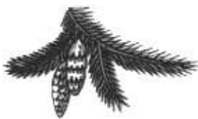
5. _ ( с елки ).