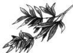
4. ( с ивы ).