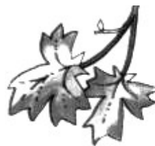
2. _ ( с клена ).