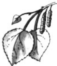
1. Берёзовый листик ( с березы )

Рассмотри картинки. Подумай, с какого дерева сорваны нарисованные на них листья.