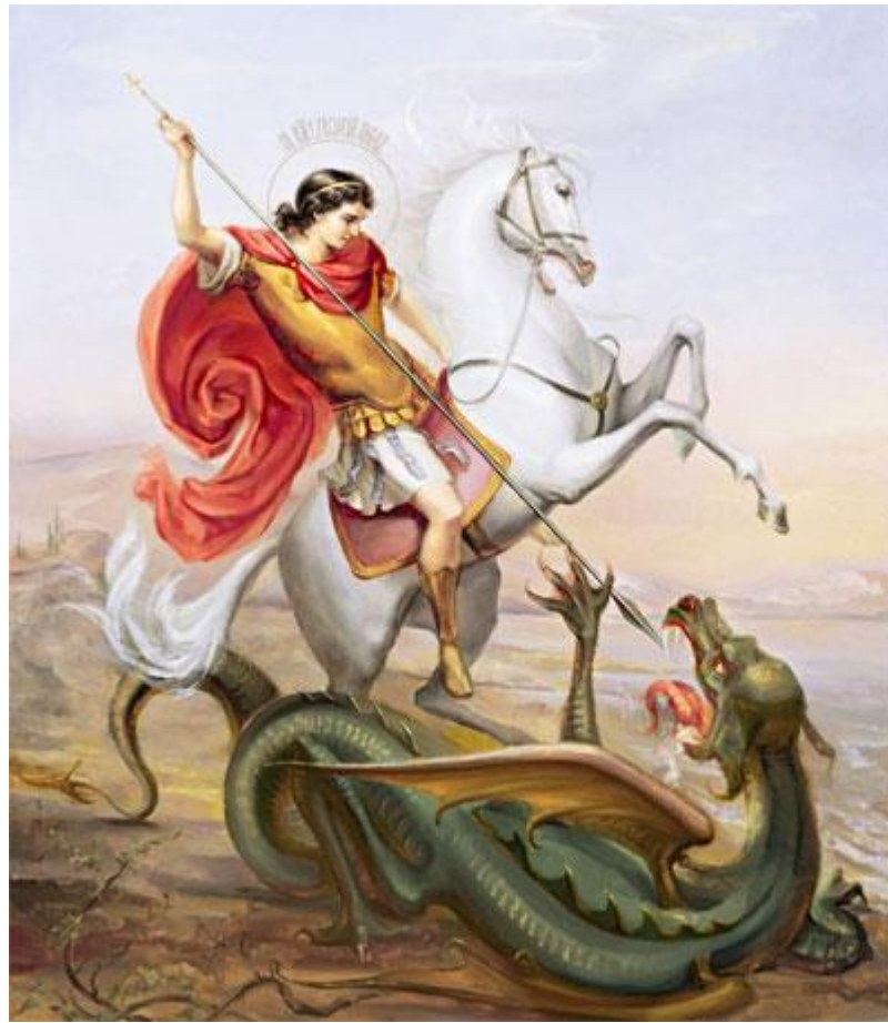
Фото: 23 ноября - День памяти святого Георгия Победоносца

Как правило, святого изображают побивающим острым копьем змия. При этом Георгий восседает на коне белоснежной окраски. Причиной такого написания угодника Божия на полотнах послужило событие, подтверждаемое преданием. Последнее имеет самое прямое отношение к чудесам, случившимся после гибели святого. Было время, когда близ города Бейрута, откуда происходил Георгий Победоносец, в одном озере жил змий. Это страшное чудовище регулярно убивало местных жителей, которые становились в итоге его обедом. Некоторые утверждали, что внешне жуткий зверь походил на гигантскую ящерицу, другие – что похож он был на крокодила, третьи же приписывали змию все признаки удава. Чтобы змий особенно не буйствовал, обитатели окрестностей периодически устраивали жеребьевку, в результате которой очередной жертвой чудовища становился молодой юноша либо красная девица. И вот, однажды жребий пал на дочь местного правителя. Девушку привязали к стволу дерева, растущего на берегу озера, и оставили на растерзание зверю. Бедная жертва оказалась абсолютно одна, еле живая от страха.