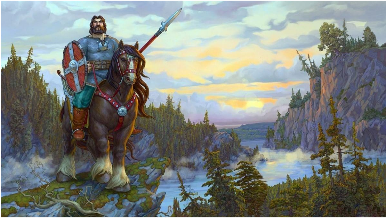
Степан Гилёв «Илья Муромец»