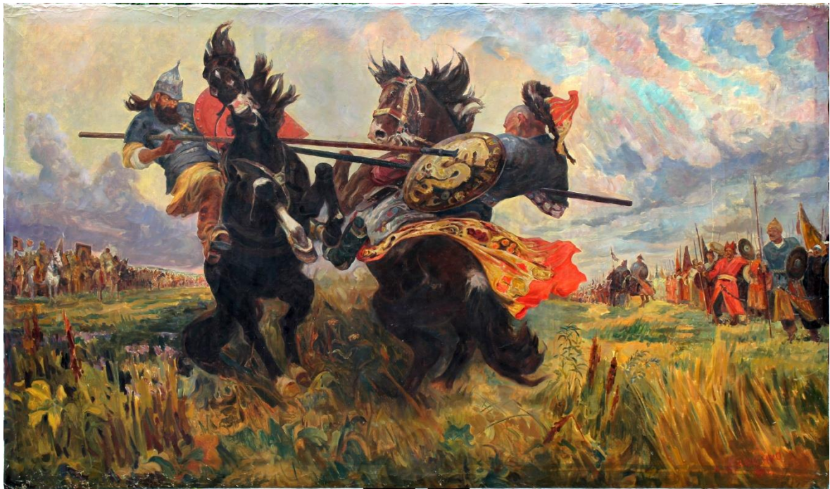
Челубей и Пересвет. Куликовская битва