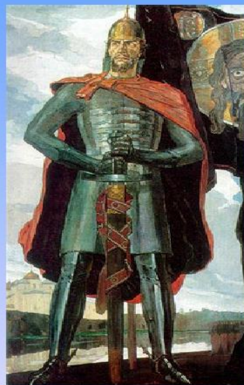
П. Корин. Александр Невский