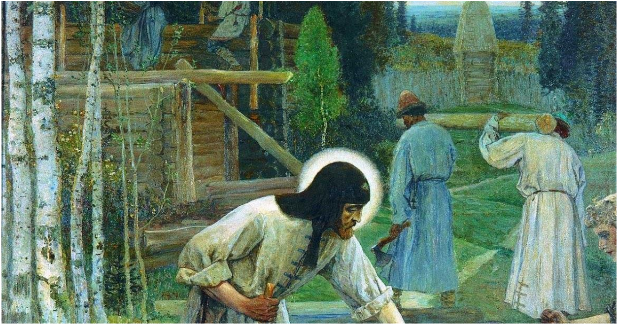
Михаил Нестеров «Труды преподобного Сергия Радонежского»