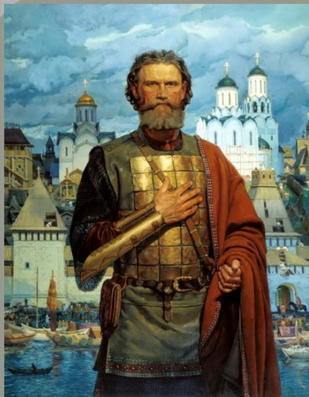
Маторин В.В., 2003 Святой благочестивый князь московский Дмитрий Донской