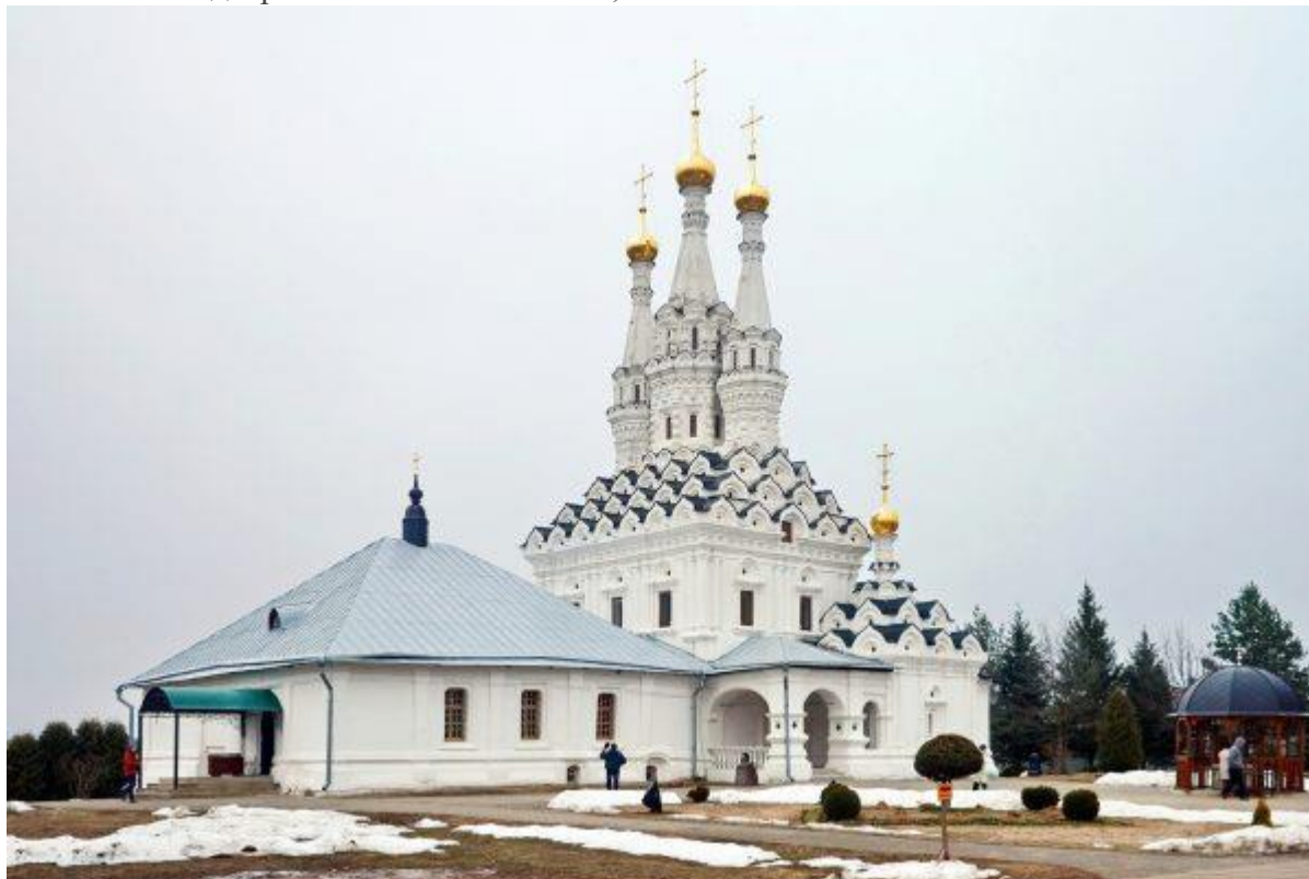
Одигитриевская церковь внесена в список наследия ЮНЕСКО