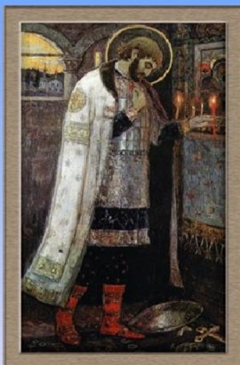
М. Нестеров. А. Невский