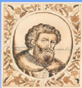
Н. Рерих. "Александр Невский"