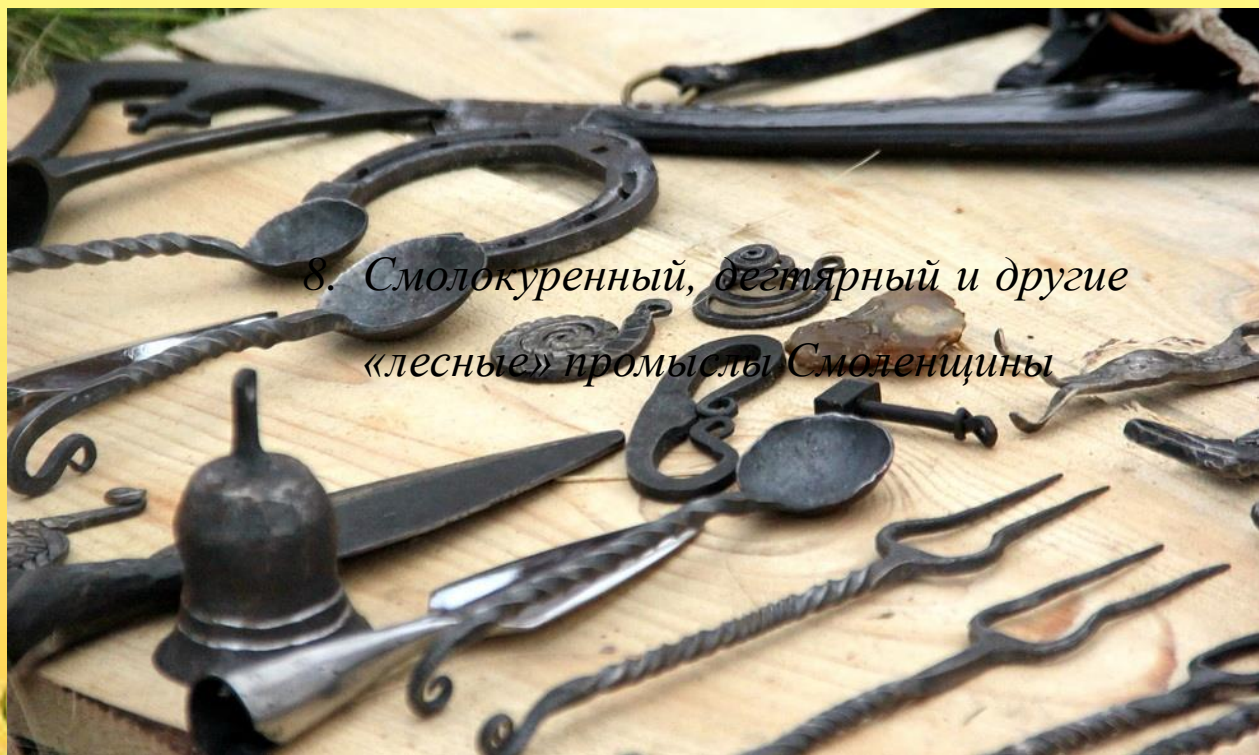
8. Смолокурный, дегтярный и другие «лесные» промыслы Смоленщины