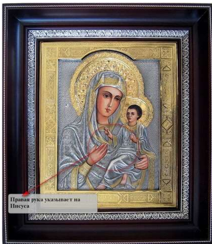
Правая рука указывает на Иисуса

Одигитрия — самый распространенный вид иконописи Божьей матери, по некоторым сведениям, впервые написанный евангелистом Лукой. Данный тип обычно изображается следующим образом: Пресвятая Богородица показана по пояс или же в случае иконы Казанской Божьей матери - по плечи, реже — во весь рост. Характерным признаком ее расположения считается легкий наклон головы в сторону своего сына Иисуса Христа. Держит Богоматерь его на левой руке, а правой рукой указывает на него. Иисус Христос же в левой руке держит