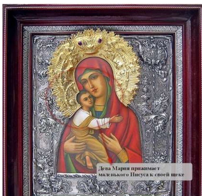
Дева Мария прижимает маленького Иисуса к своей щеке

Елеуса всегда изображается так: Дева Мария прижимает к своей щеке Иисуса Христа, тем самым проявляя к нему свою любовь, нежность и сострадание. В данном типе изображения между сыном и матерью нет расстояния, что символизирует безграничную любовь и единение. И поскольку образ Божьей Матери является символом и идеалом рода человеческого (Церкви земной), а Иисус символом Церкви