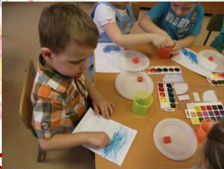
Рисунок тогда, получается, по сырому, когда в еще не засохший фон вкрапывается краска и разляпывается тампоном или широкой кистью.