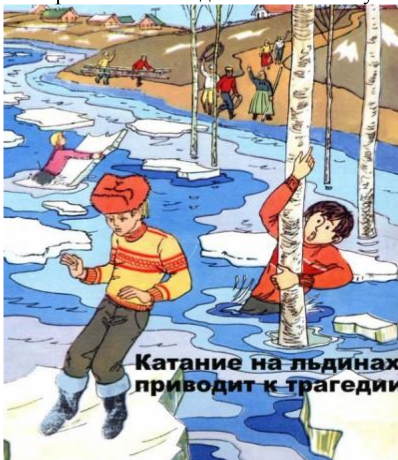
Катание на льдинах приводит к трагедии

Приближается время весеннего паводка. Лед на реках становится рыхлым, «съедается» сверху солнцем, талой водой, а снизу подтачивается течением. Очень опасно по нему ходить: в любой момент может рассыпаться под ногами и сомкнуться над головой