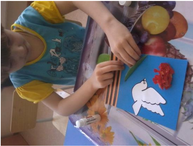
Наша открытка готова!