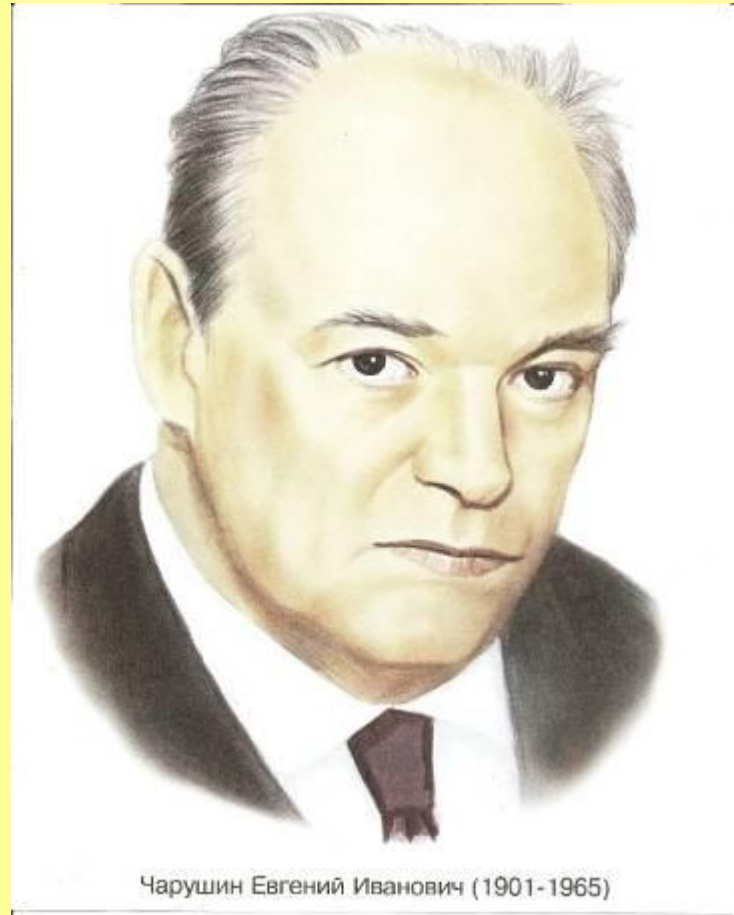
Евгений Иванович Чарушин