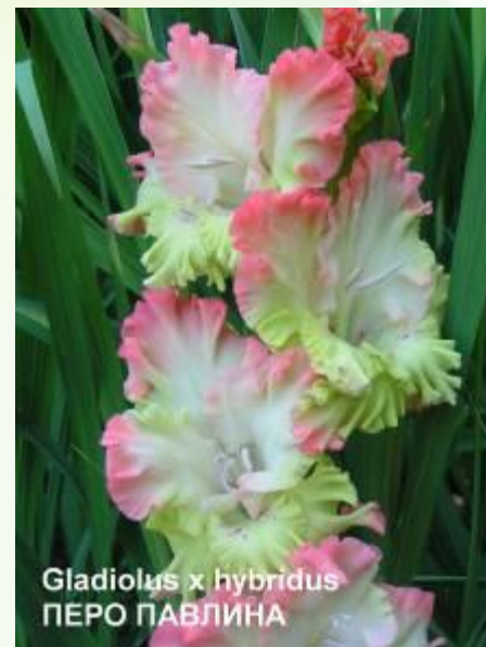
Gladiolus x hybridus ПЕРО ПАВЛИНА