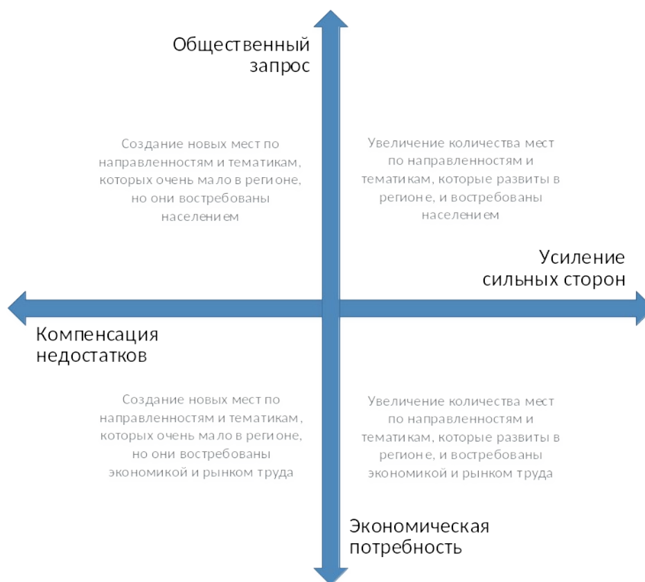
Рис. 2. Шкалы выбора тематики и тактики создания новых мест дополнительного образования