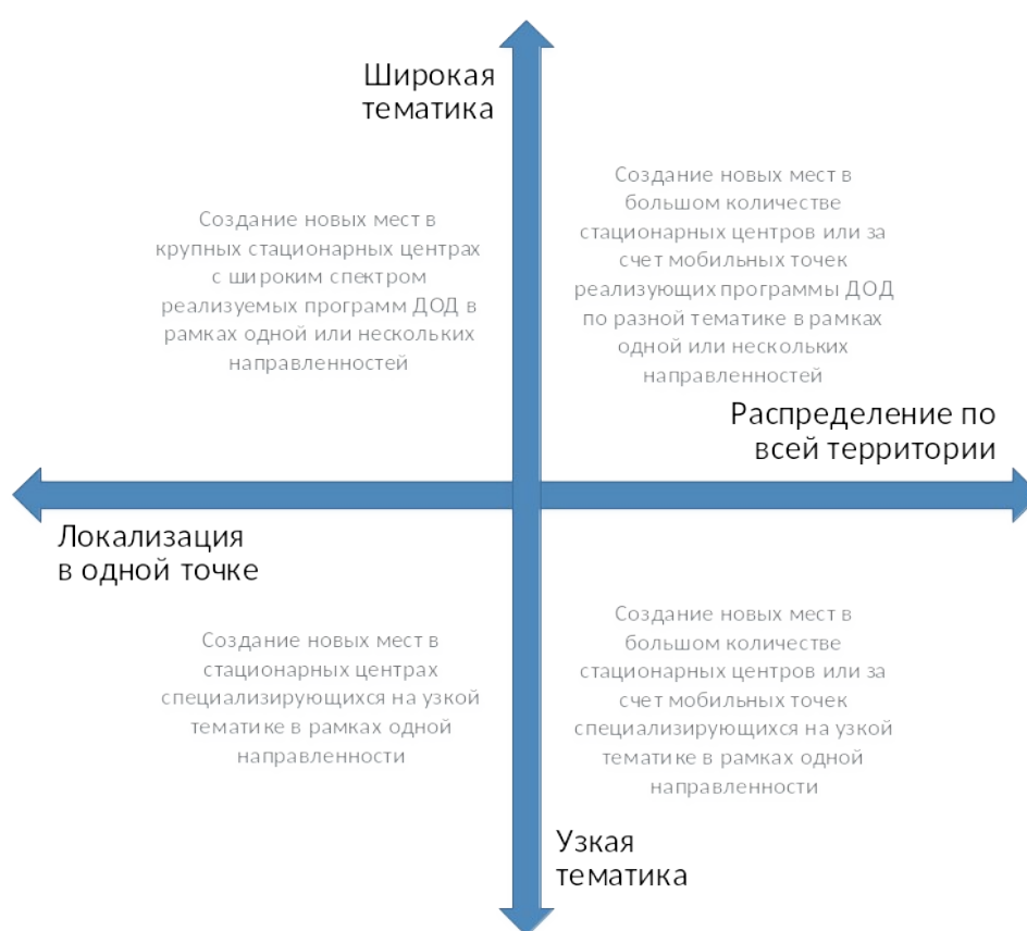
Рис. 3. Шкалы выбора масштаба и формы реализации новых мест по программам ДОД

При невыполнении хотя бы одного из них возникает необходимость пространственного распределения реализуемой модели через мобильные или сетевые решения. В регионе с большой площадью и/или плохой логистикой невозможно обеспечить очный доступ к услугам данной модели для всех желающих, за исключением программ с использованием дистанционных технологий. В регионе с низкой плотностью населения вложения в такой масштабный по материально-техническому оснащению проект принесут очень низкую отдачу.