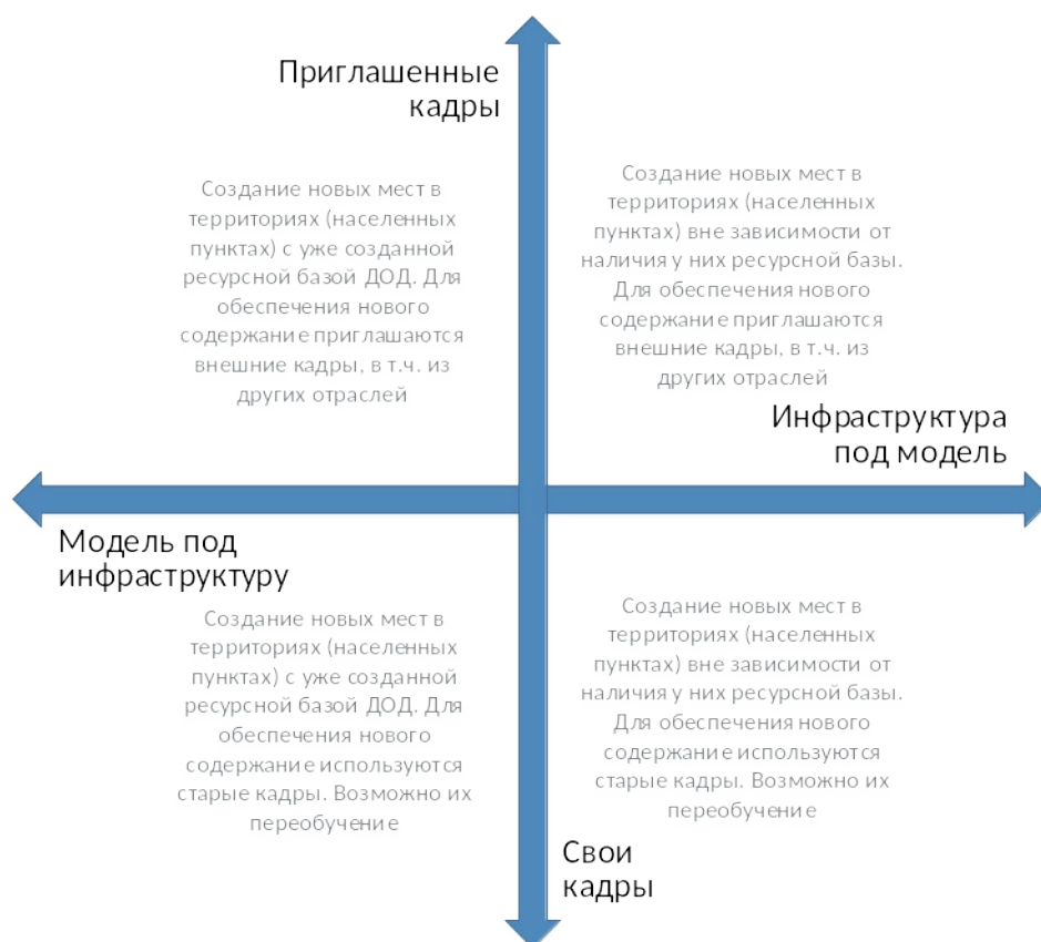
Рис. 6. Шкалы выбора модели инфраструктурного и кадрового обеспечения для типовой модели создания новых мест дополнительного образования

Следует отметить, что механизмы инфраструктурного и кадрового обеспечения не существуют в их полярных вариантах. Решения даже в рамках реализации одной модели будут различны. Анализ перечисленных выше характеристик позволяет сделать эти точечные решения более точными и эффективными.