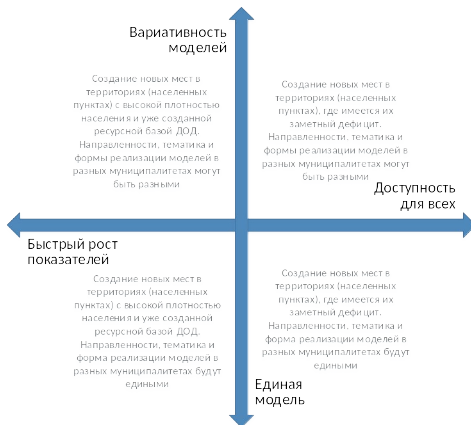
Рис. 4. Шкалы выбора модели создания новых мест с учетом актуальной управленческой политики