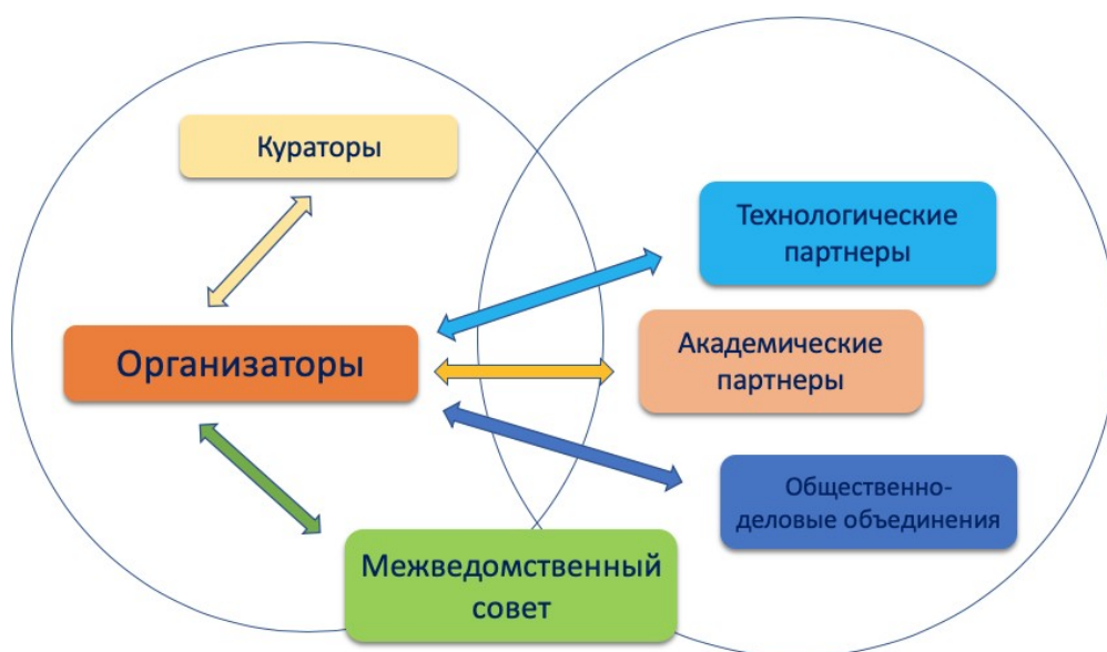
Рис. 1. Схема взаимодействия участников мероприятий по внедрению и функционированию типовой модели «Диалог наук»

Схема взаимодействия участников мероприятий по внедрению и функционированию типовой модели «Диалог наук» приведена на рис. 1.