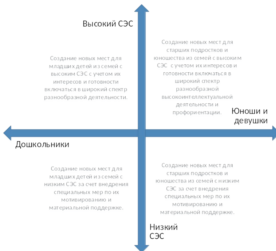
Рис. 5. Шкалы выбора модели создания новых мест по программам естественнонаучной направленности с учетом особенностей контингента обучающихся

Вовлечение в программы детей из семей с низким образовательным и культурным уровнем потребует осуществления определенных PR-шагов, поиска мотиваторов для данных детей, в том числе материальных.