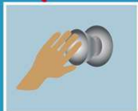
КОНТАКТ С ЗАГРЯЗНЕННЫМИ ПОВЕРХНОСТЯМИ