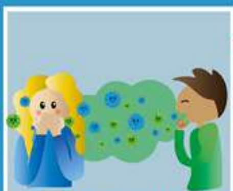
КАШЕЛЬ, ЧИХАНИЕ (ВОЗДУШНО-КАПЕЛЬНЫМ ПУТЕМ)