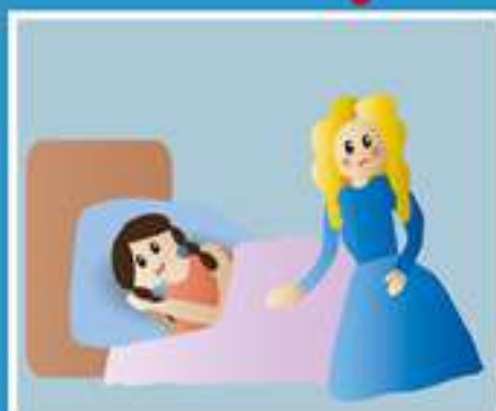
УХОД ЗА БОЛЬНЫМИ