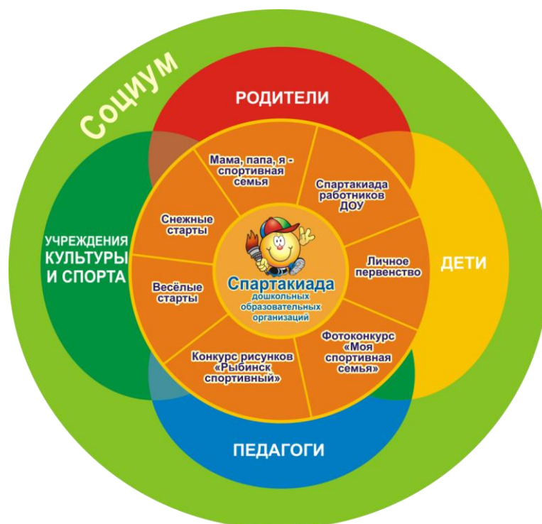
Схема взаимодействия участников внедрения практики