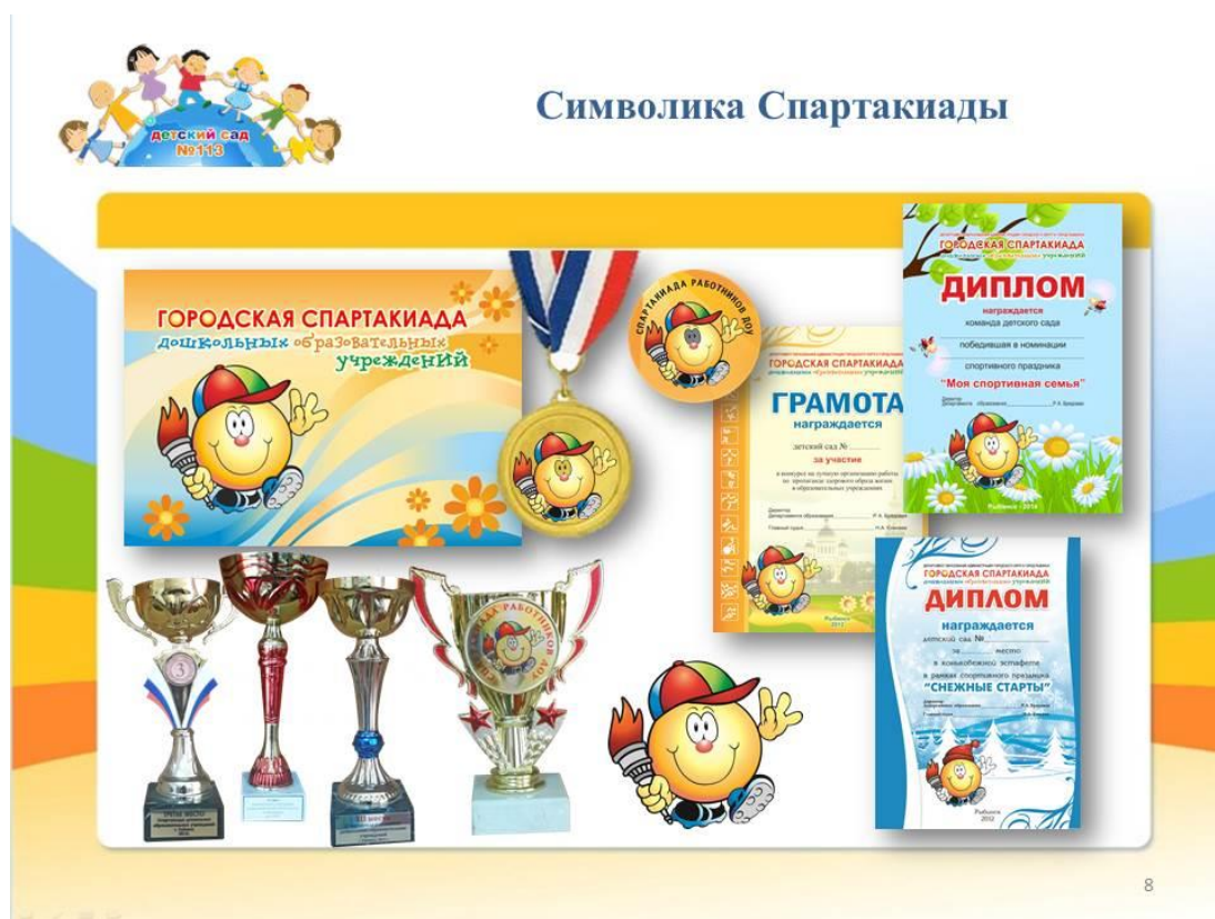
Фирменный стиль Спартакиады