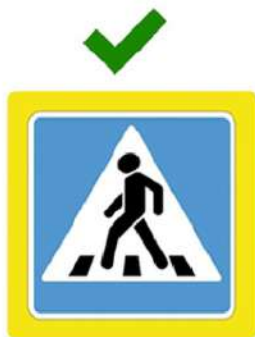
Наземный пешеходный переход

Он обозначен дорожными знаками «Пешеходный переход» и белыми линиями разметки «зебра».