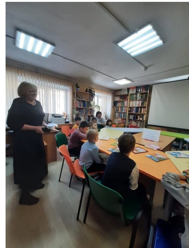
Детская городская библиотека