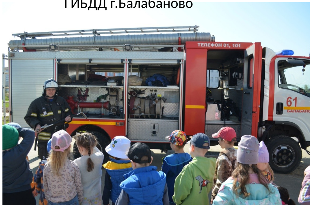
ПСЧ №61 г.Балабаново

Активно сотрудничаем с организациями города, и области к нам приезжает «Лаборатория безопасности»