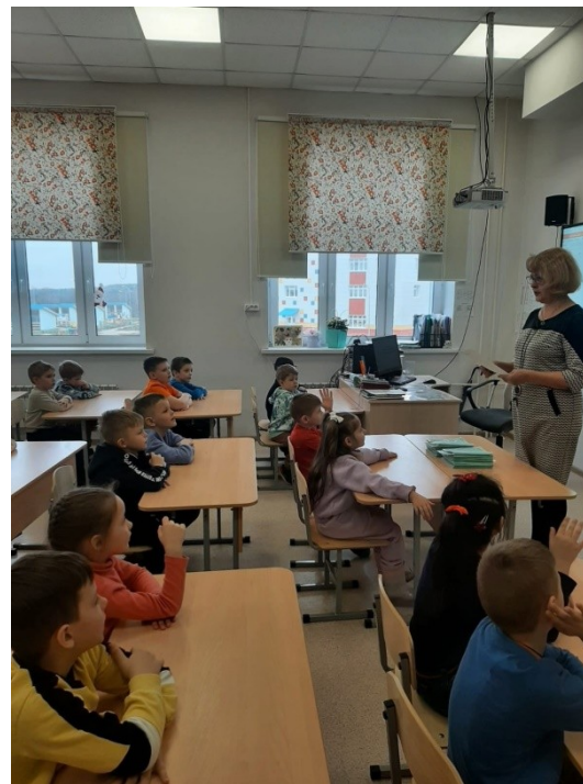
МОУ СОШ №5 г.Балабаново