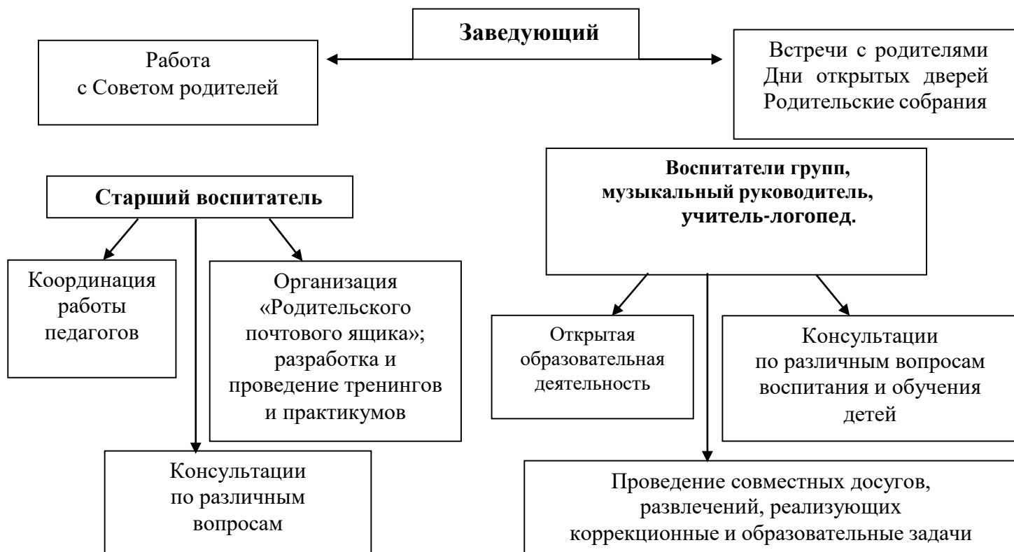
Схема взаимодействия с семьями воспитанников