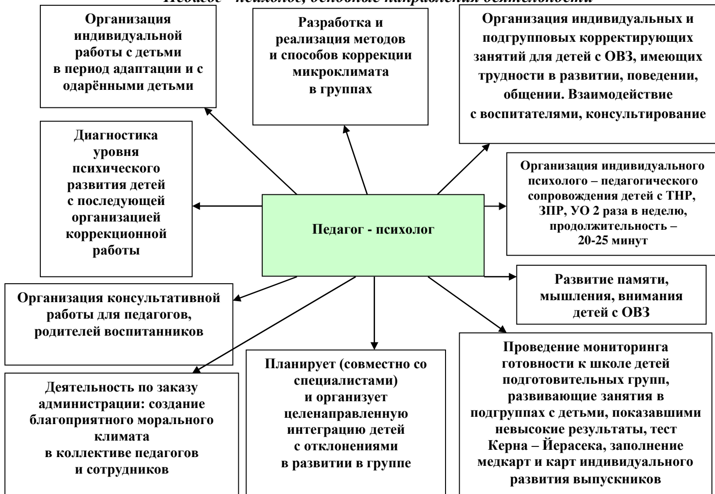
Рис. 2 «Педагог - психолог, основные направления деятельности».