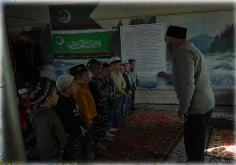
Мы в мечети.