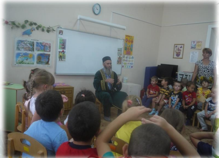
Вместе против террора!