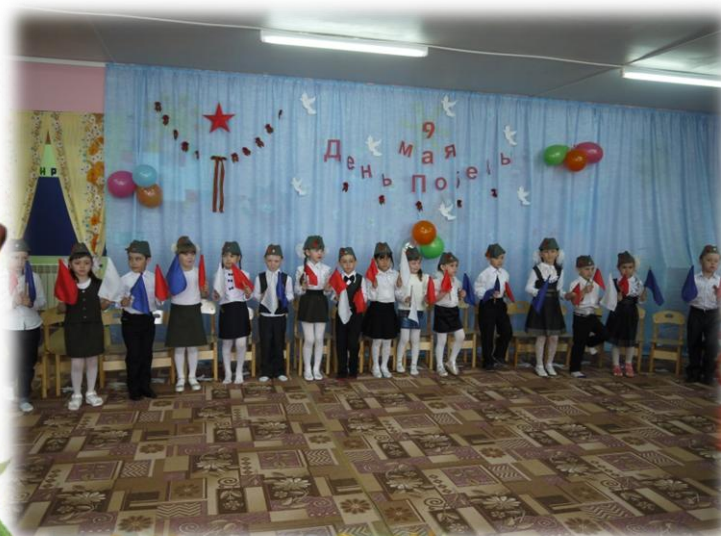
Тематический утренник, посвященный Дню Победы