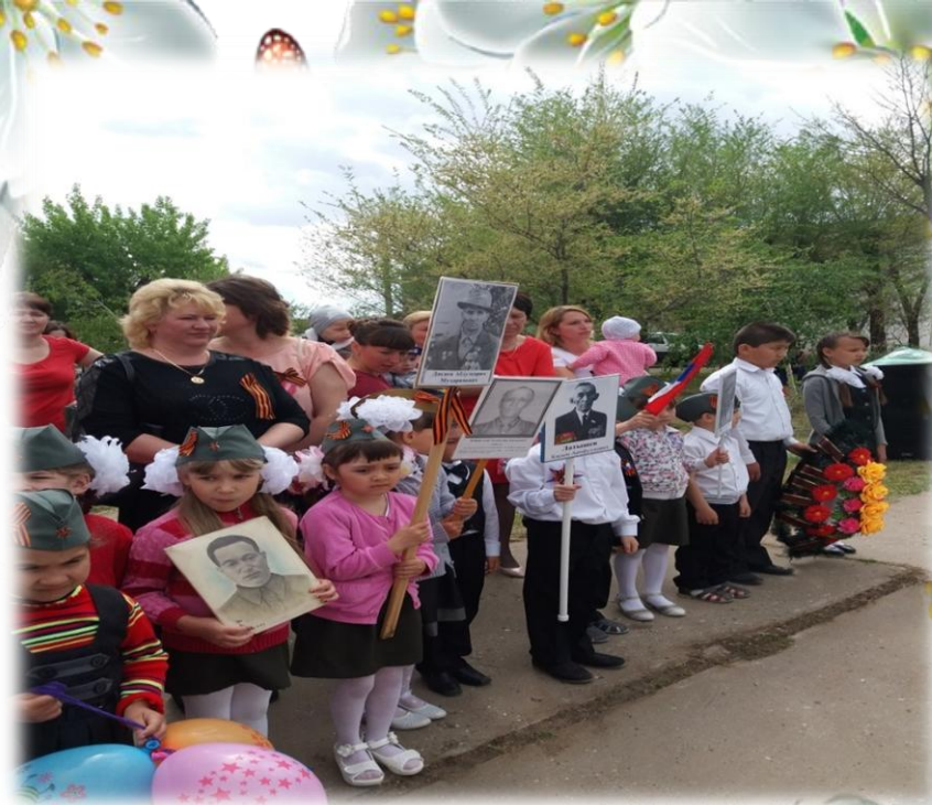
На митинге у Братской могилы