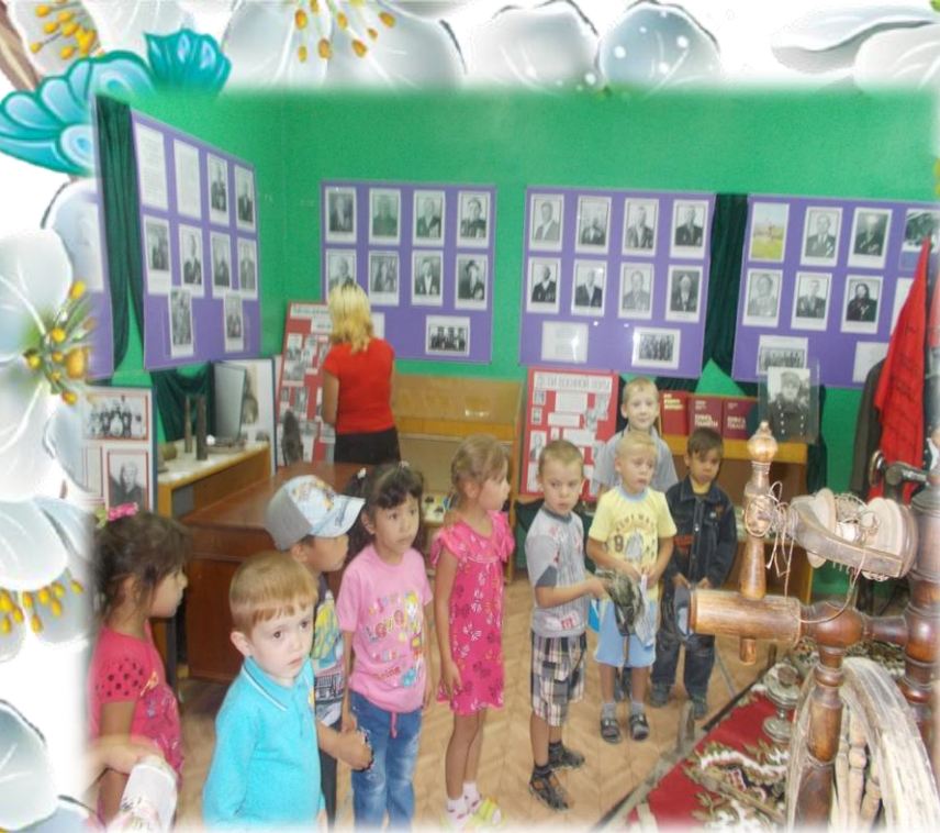
В школьном историко- краеведческом музее