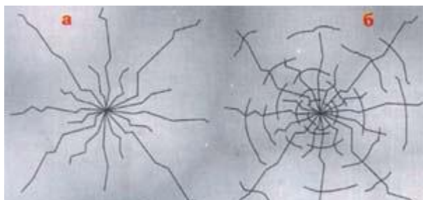
Рис.4. Типы растрескиваний льда под нагрузкой: а – радиальные трещины, не ведущие к провалу груза; б – радиальные трещины, сопровождаемые концентрическими разрушениями, ведут к быстрому провалу груза.

Об упругих свойствах льда говорят следующие количественные данные. Если рассматривать прозрачный, наиболее прочный лед, то при центральном прогибе его в 5 см трещин на нем не образуется; прогиб в 9 см ведет к усиленному образованию трещин, прогиб в 12 см вызывает сквозное растрескивание, при 15 см лед проваливается. Трещины под действием нагрузок возникают двух типов: радиальные (рис.4-а) и концентрические (рис.4-б).