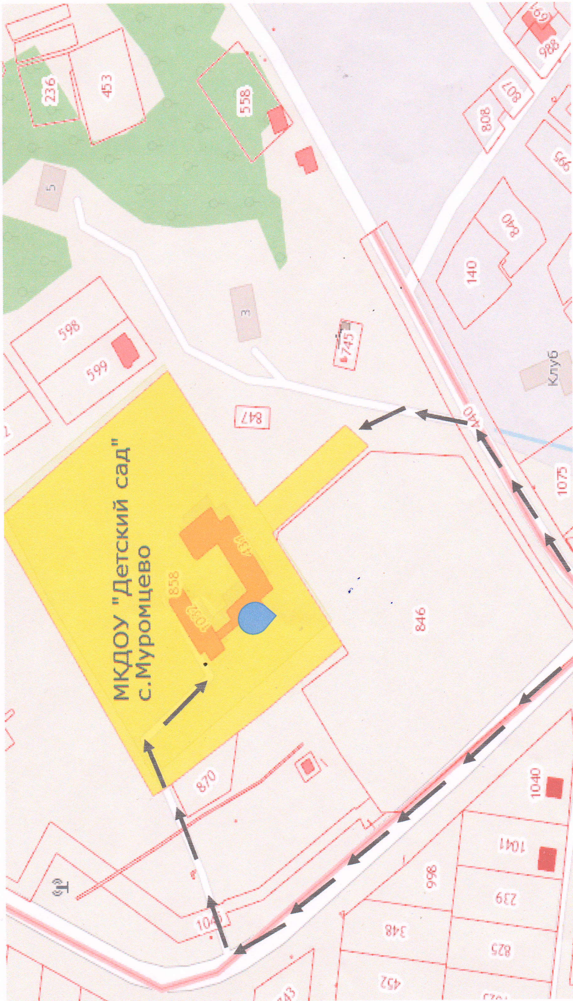
Схема №3. Пути движения транспортных средств к местам разгрузки