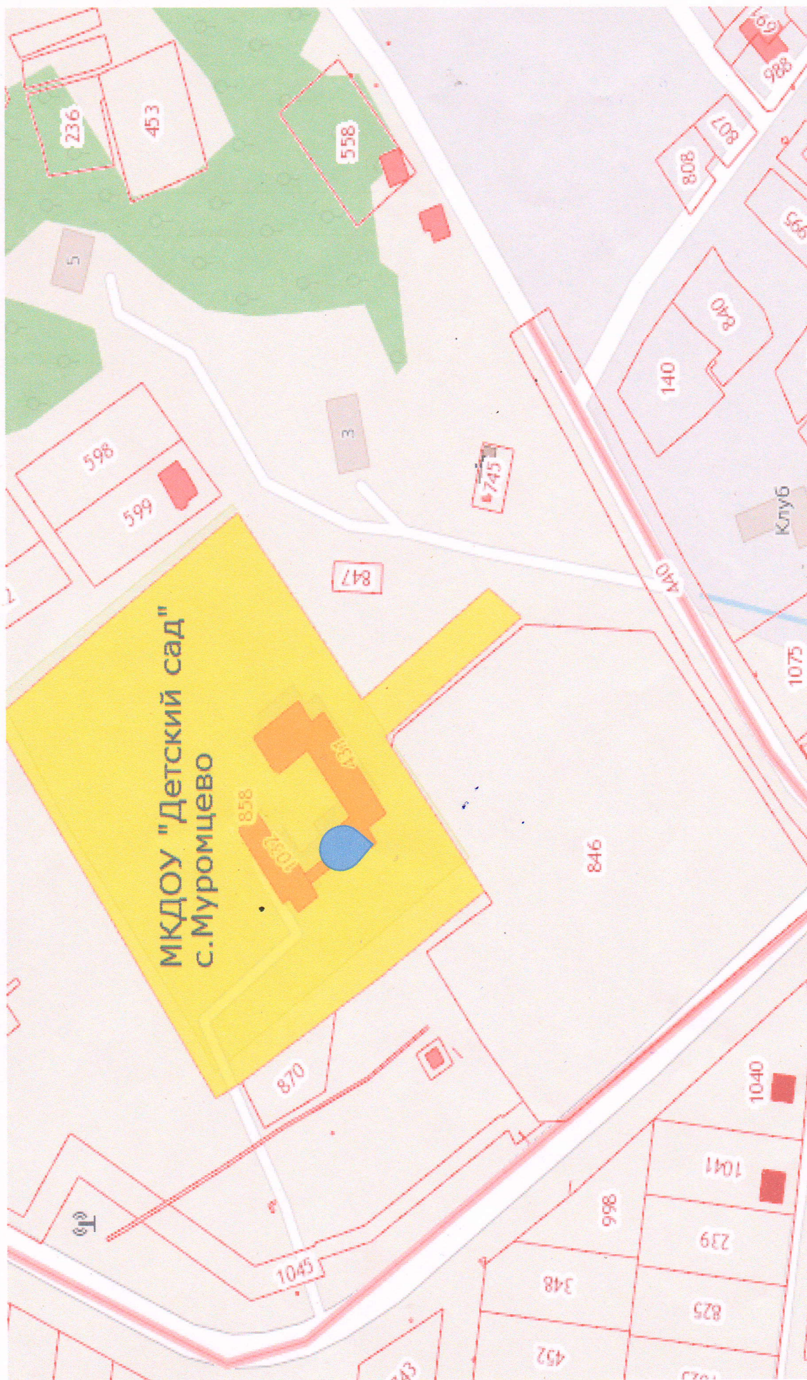
Схема №1. Район расположения образовательной организации