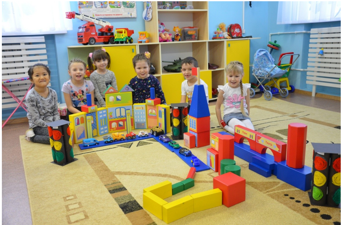
Проведение досуговых и театрализованных мероприятий совместно с родителями воспитанников