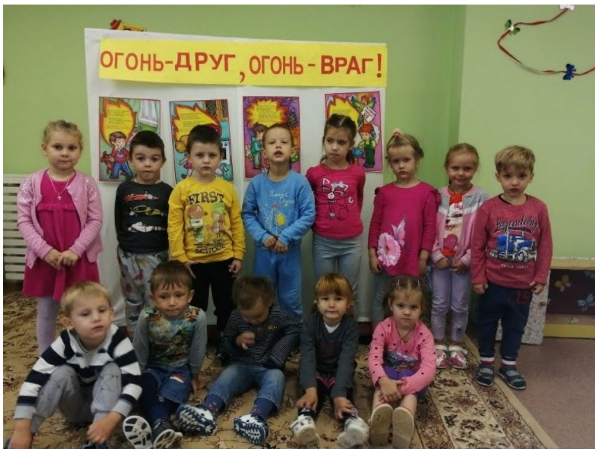
Работа по ОБЖ и ПДД в совместной деятельности педагога и детей