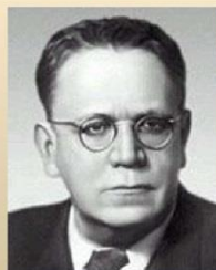
Самуил Яковлевич Маршак