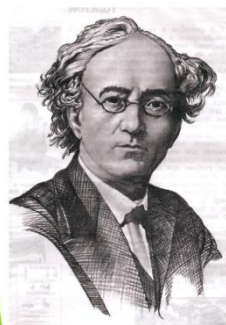
Тютчев Фёдор Иванович