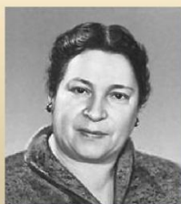
Агния Львовна Барто