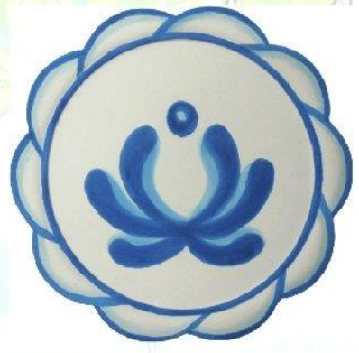
Поэтапное рисование узора гжели