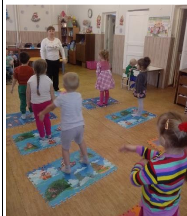
Танцевально-игровая гимнастика «СА-ФИ-ДАНСЕ»