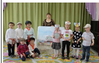
ОД с использованием театрализации в старшей группе «Приключение Мухи-Цокотухи»