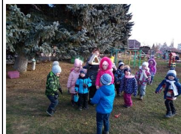
Проект «Птичья кормушка»