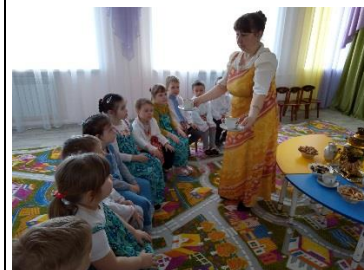
Проект «День чая»

2. Жанровые фотографии (во время образовательной деятельности с детьми, игр, прогулки, детских праздников) (не более 5)