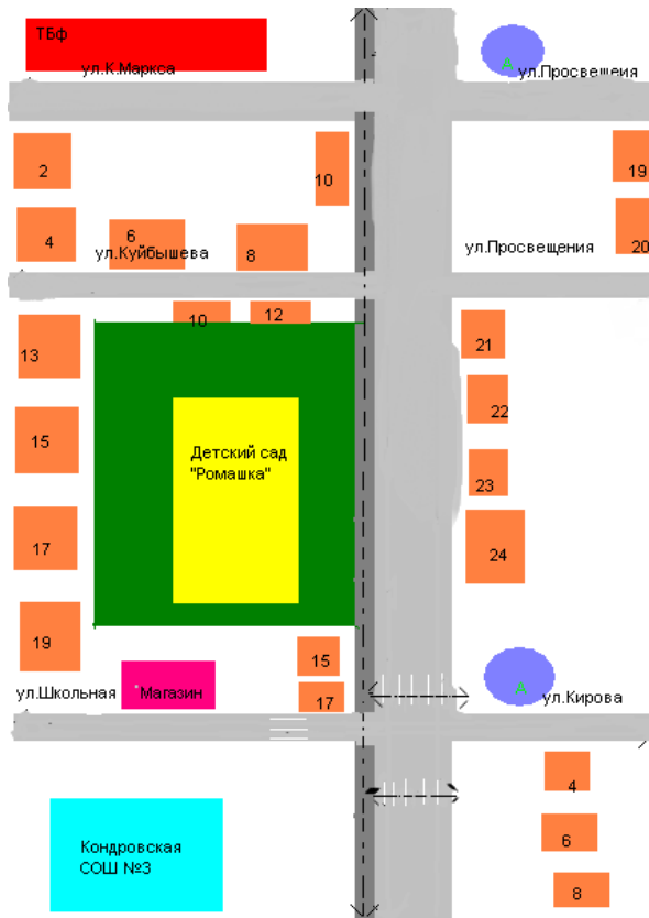
Схема организации дорожного движения в непосредственной близости от образовательного учреждения с размещением соответствующих технических средств, маршруты движения детей и расположение парковочных мест