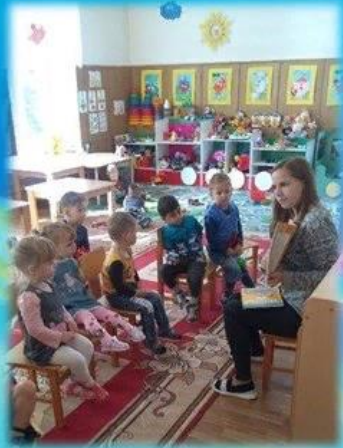
Беседа «Хочу быть БОЛЬШИМ»