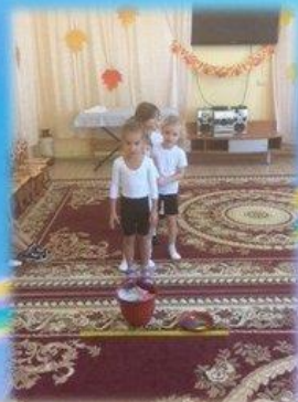
Встреча с доктором Пипюлькиным