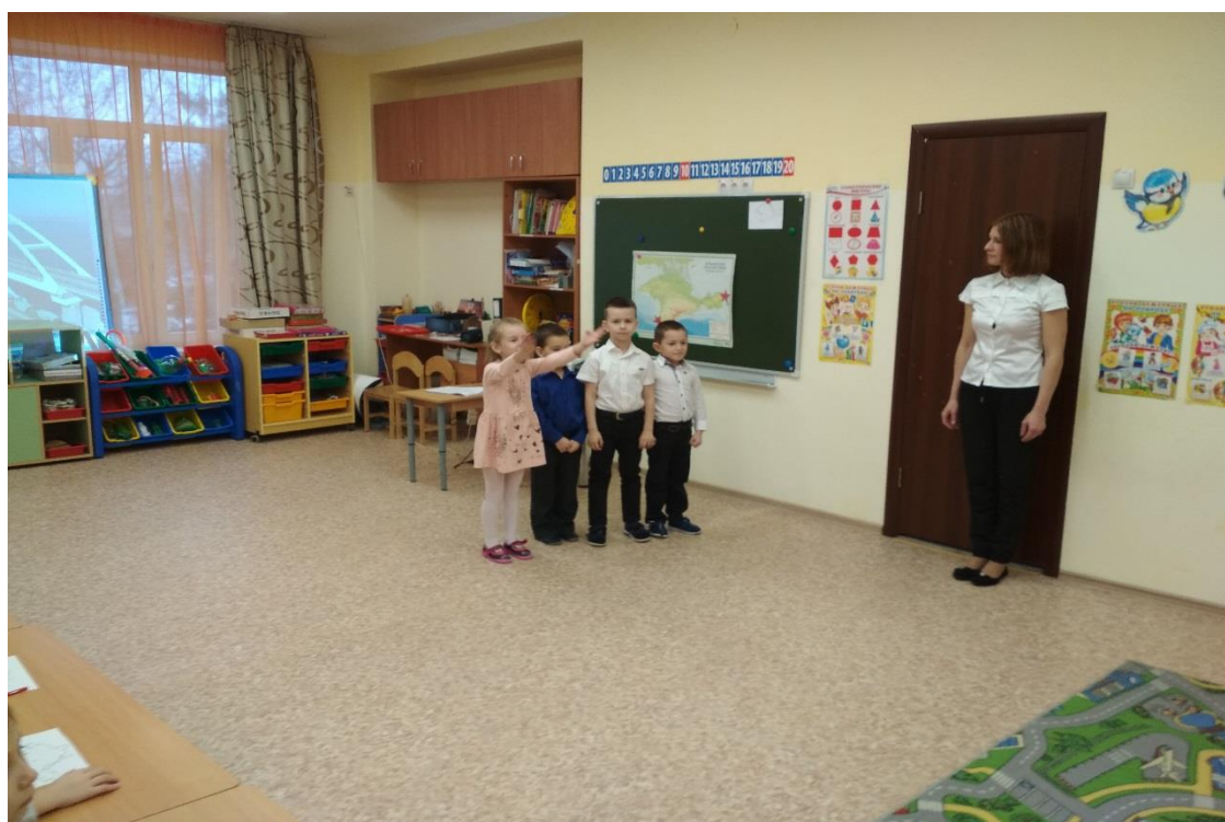
Стихотворения о Крыме