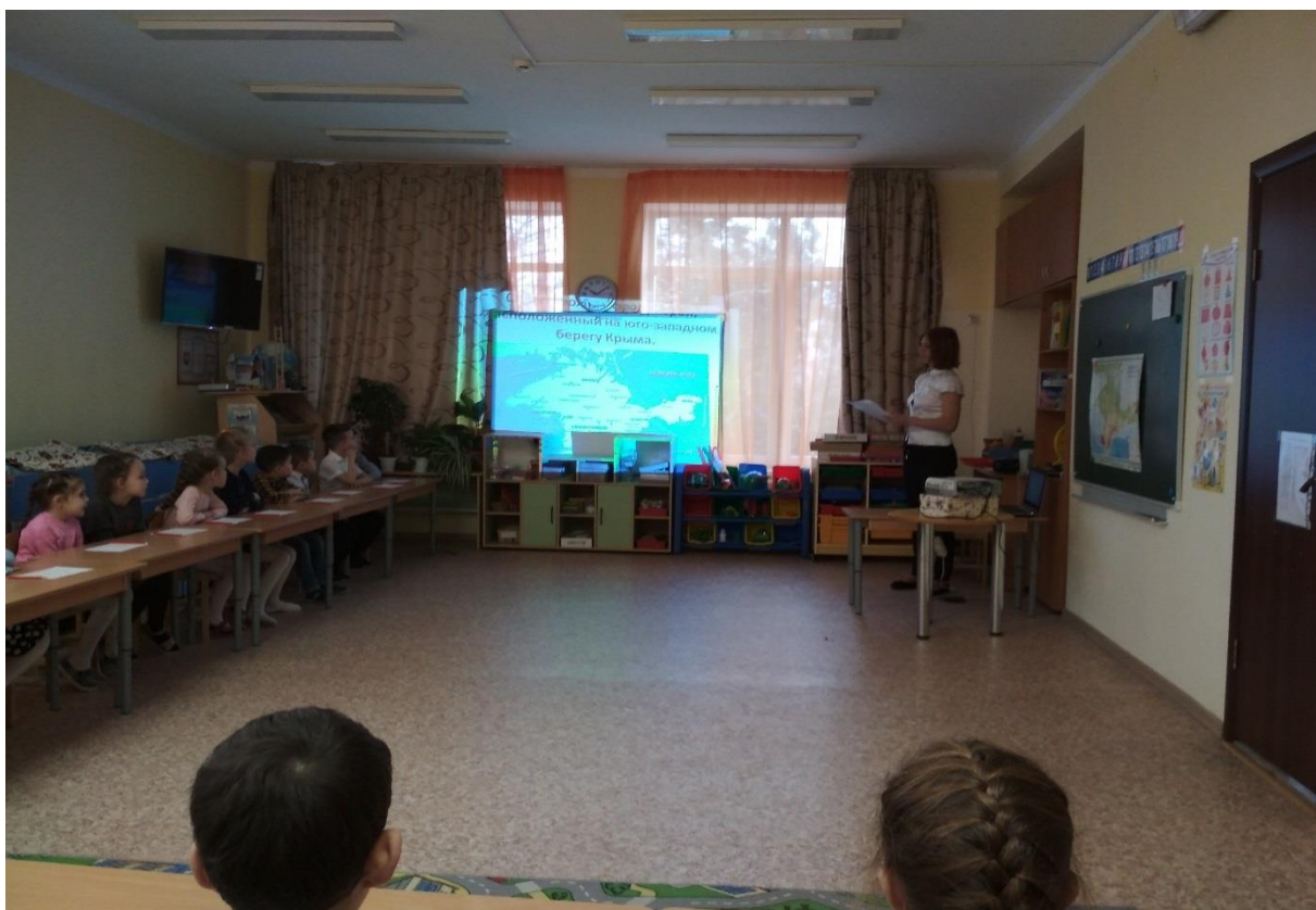
Презентация «Города-герои Крыма»