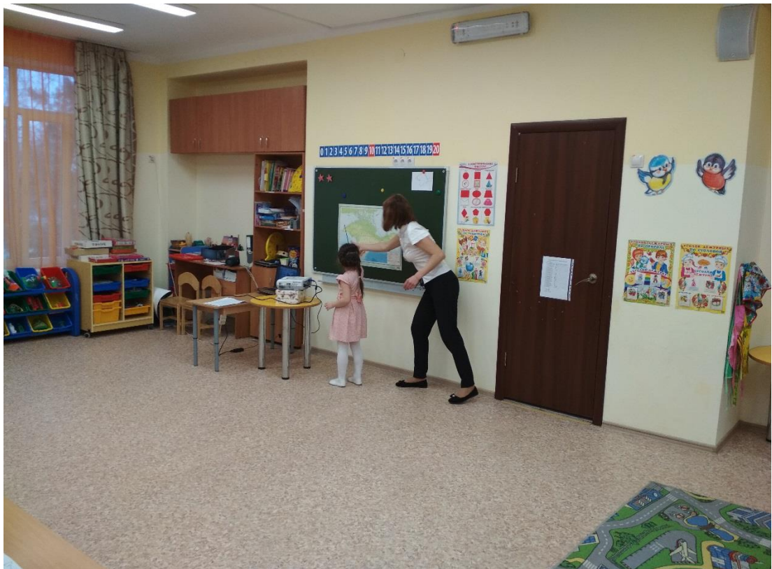
Дети показывают Города-Герои на карте Крыма